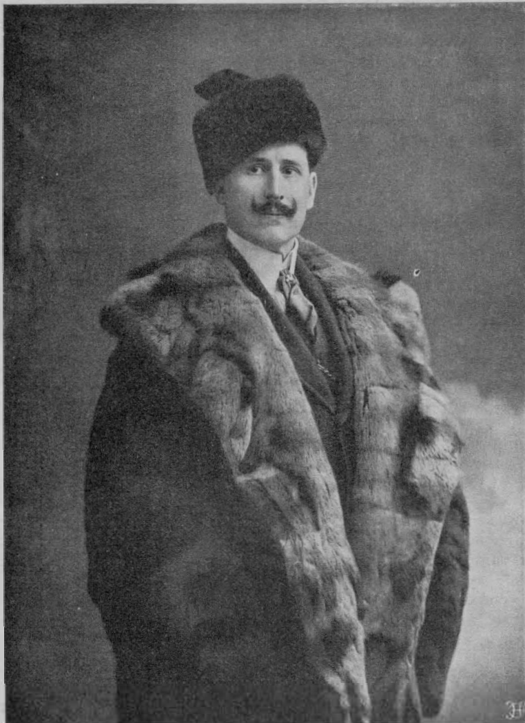
А Р Т И С Т Ъ ИМПЕРАТОРСКИХЪ ТЕАТРОВЪ