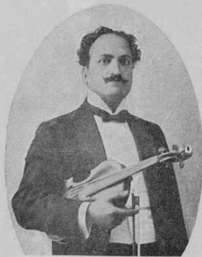
Извѣстный скрипачъ Армандо Цахибоки.

Къ концерту 22 февраля въ Маломъ залѣ Консерваторіи.