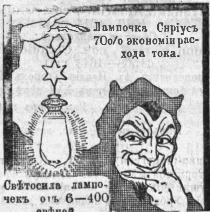
Лампочка Сиріусъ 70% экономіи рас- хода тока.

Спб., Ямная ул., д. 44. Телеф. 810-73. Отд. Москва, Ростовъ на Д., Екатери- нославль, Ревель и Царское Село.