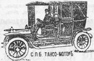
С. П. Б. ТАКСО-МОТОРЪ

По установленной таксѣ принимаетъ днемъ и ночью заказы на „ТАКСО-МОТОРЫ“ въ Гаражѣ, Невскій, 108, и по телефонамъ 62—65 и 78—58, также на собственной