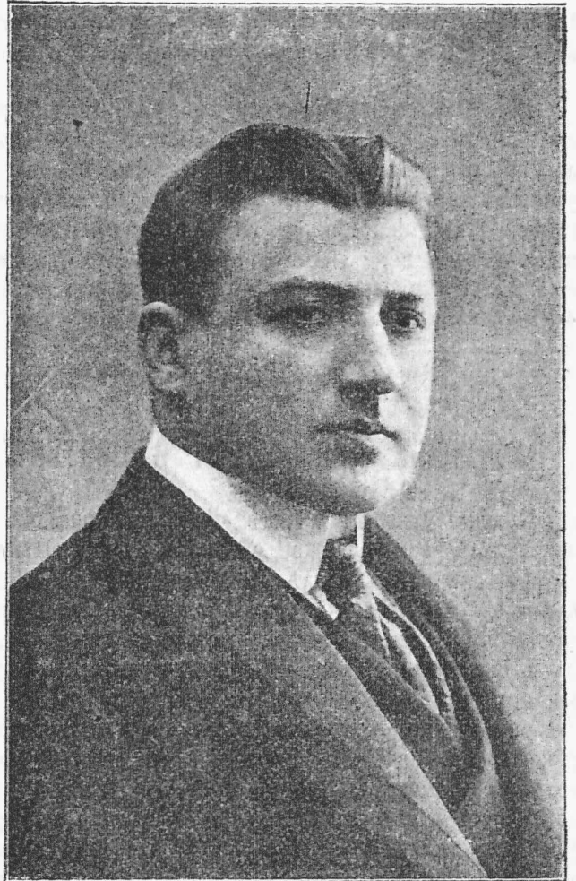
Артистъ Императорскихъ театровъ