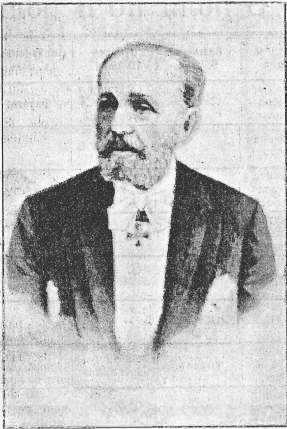
† М. И. Петипа.