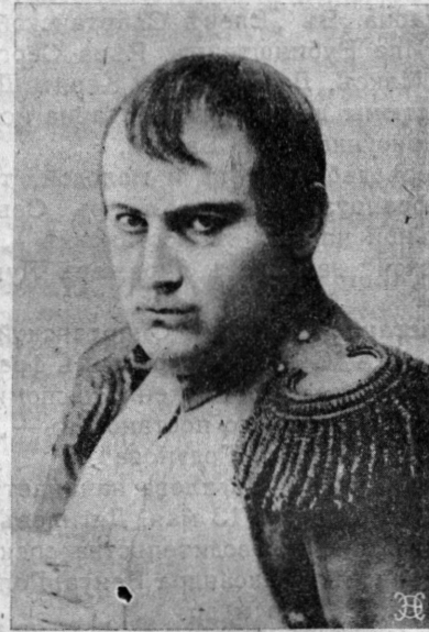
Рафаиль Адельгеймъ въ роли Наполеона, въ „Мадамъ Санъ-женъ“.

Къ гастролямъ Бр. Адельгеймъ въ Зим. Буффѣ.