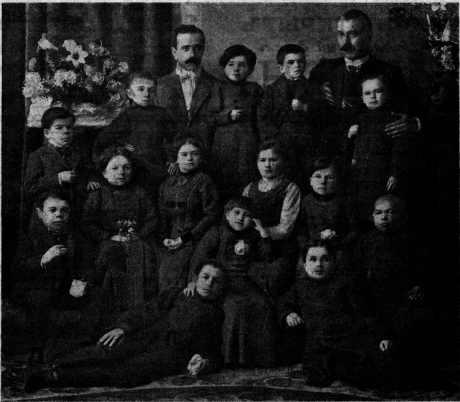
Труппа русских лилипутовъ въ саду „Аркадія“.