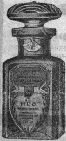
Флаконъ 1 р. 2 р.