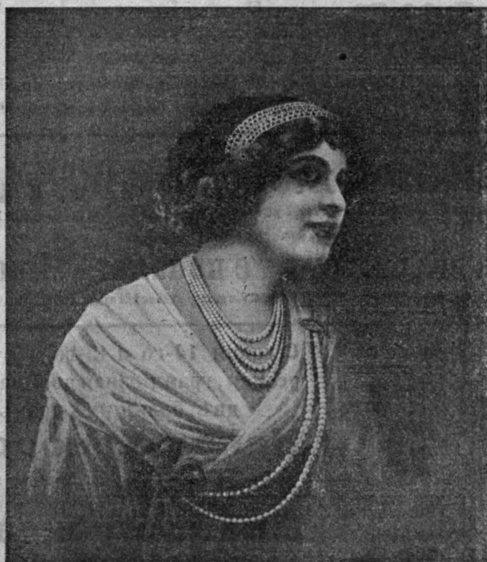
ЖЕМЧУГА КЕПТА и НАСТОЯЩІЕ БРИЛЛАНТЫ. ДРАГОЦѢННОСТИ ИСПОЛНЕНЫ НАШИМИ ПАРИЖСКИМИ ХУДОЖНИКАМИ.