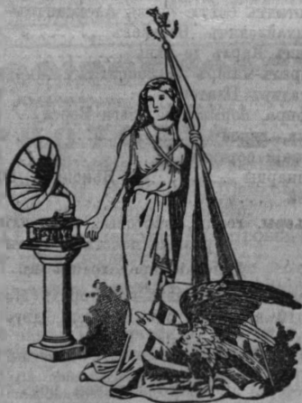
ДОПУСКАЕТСЯ ЛЬГОТНАЯ РАСЧЕТКА ПЛАТЕЖА.

Патентованные безручные граммофоны самой прочной конструкции. Цѣны отъ 10 р. до 300 р. Всемирно-известна. тал. „Тагго“. КУКОЛКА - Жильберта, ПУПСИКЪ. Громадный успѣхъ новой оперетки „Куколка“, побуждаетъ насъ особенно рекомендовать эту пластинку. Особенно рекомендуемъ пластинку „Поздравленіе съ Новымъ Годомъ“. Незамѣнимое развлеченіе и громадно удовольствие для дѣтей рекомендуемъ граммофонъ „Меркурофонъ“. Специально большой выборъ дѣтскихъ пластинокъ. Все модныя танцы, народныя пѣсни, оперы, оперетки, духовныя Рождественскія и прочія новости. Новость пластинки пшущій „Амуръ“, по 65 к. Починка и перелѣлка граммофоновъ и прочіихъ музыкальныхъ ящиковъ. Фабричный слѣдъ граммофоновъ „МЕРКУРОФОНЪ“. Заго-оный проспектъ, домъ № 9. Телефонъ № 456-00.