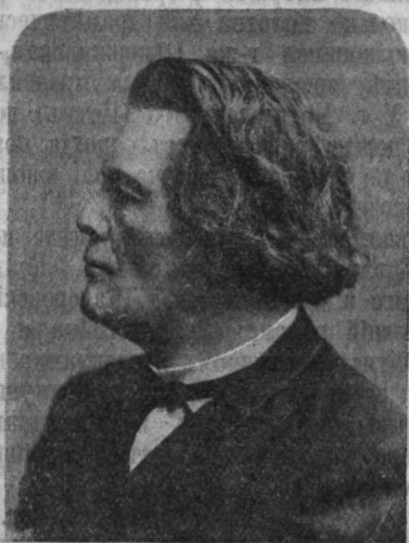
А. Г. Рубинштейнъ.

Гениальный виртуозъ, сумѣвшій послѣ Листа извлечь изъ фортепiano новья, вдохновенныя и потрясающія по красотѣ созвучія—