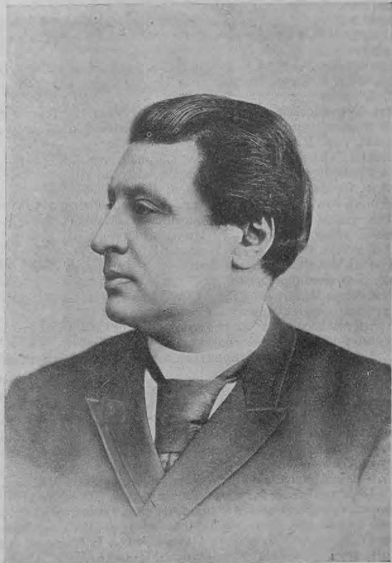
Ф. П. Горевъ.