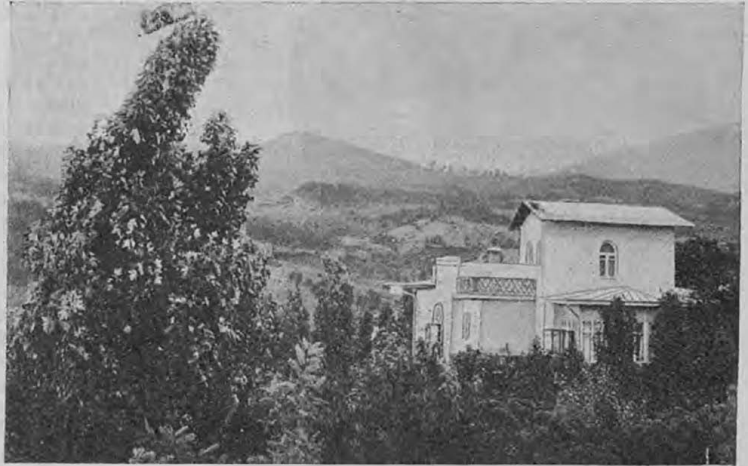
Дача А. П. Чехова въ Ялтѣ.