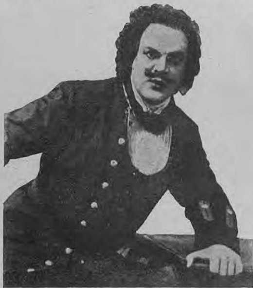
Петръ Великій въ исполн. Сперанскаго.

одинъ сезонъ, послѣ чего артистка навсегда оставитъ сцену. Не хочется вѣрить этому тревожному слуху.