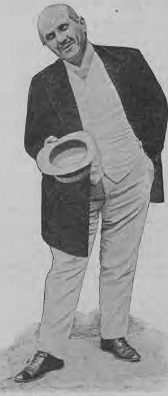
Г. Кошевскій — баронъ.