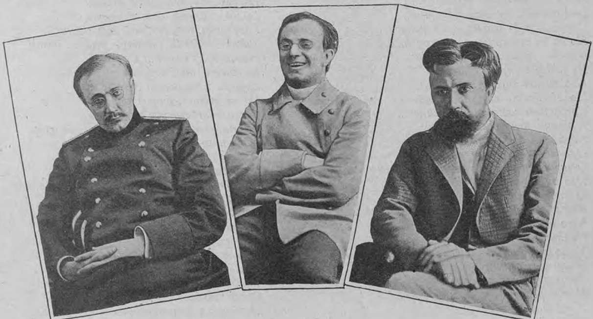
Тузенбахъ („Три сестры“).