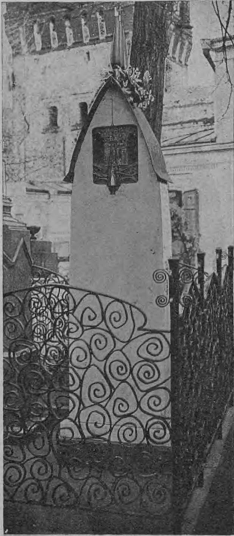
• Снимокъ фот.-люб. С. П. Покровскаго.