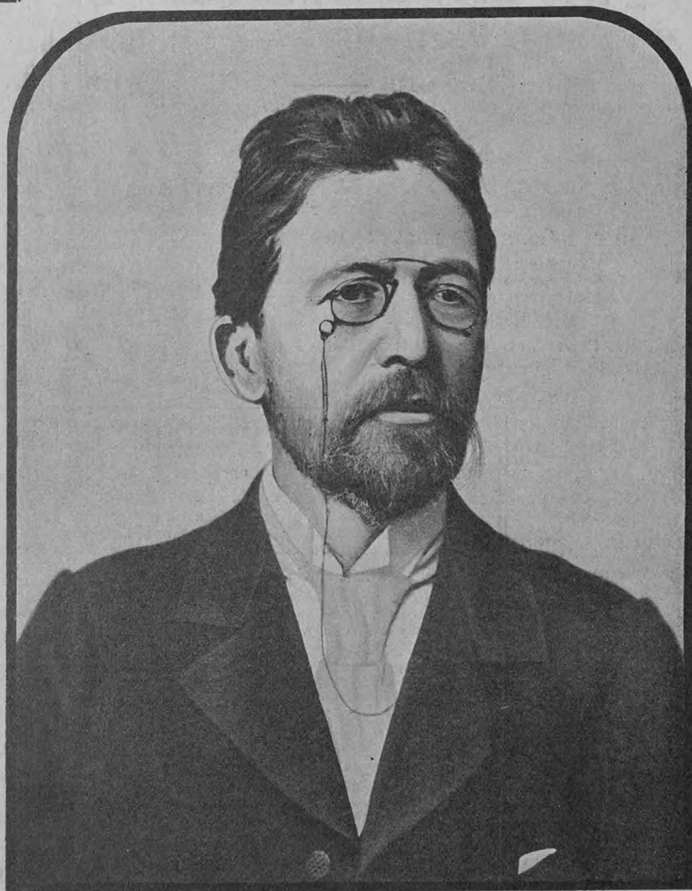
А. П. Чеховъ.