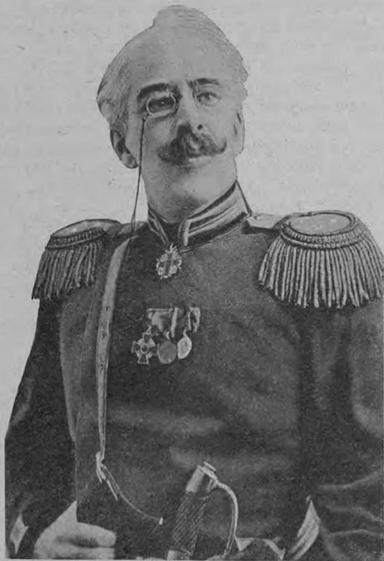
К. С. Станиславскій въ роли Вершинина („Три сестры“).

Чеховъ никогда не считалъ себя сильнымъ въ драматической формѣ и почти всю свою писательскую дѣятельность посвятилъ чистой беллетристикѣ, но онъ подарилъ русскому театру рядъ прекрасныхъ созданий драматической литературы и, говоря объ этой сторонѣ творчества Чехова, нельзя отдѣлать его имени отъ имени Московскаго Художественнаго театра, символомъ котораго стала Чеховская „Чайка“.