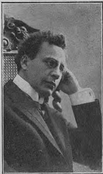
В. И. Петровъ.

Сочиненія должны быть представлены на конкурс по позднѣе 1-го октября 1911 года.