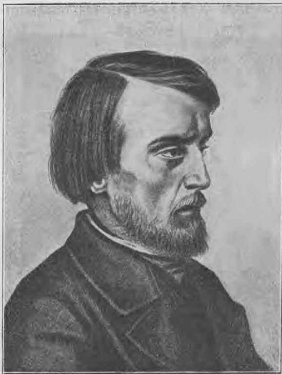
В. Г. Бѣлинскій.

Мнѣ рассказывалъ это покойный отецъ Леонидъ, настоятель Задовскаго монастыря.