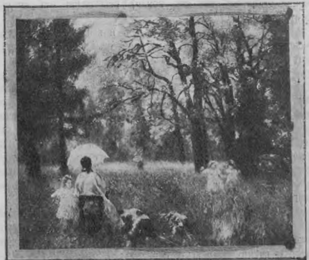
А. Ропль. — Лѣтній день.