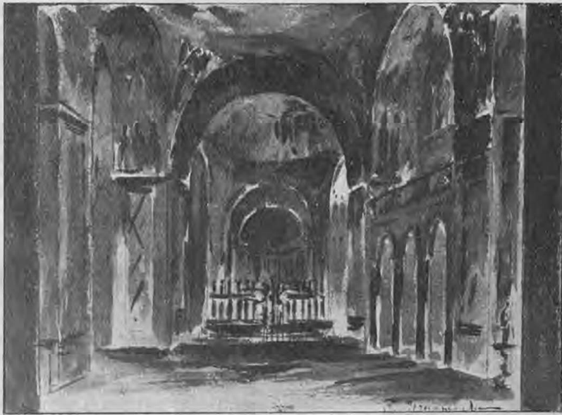
„Тоска“. Декорація 2-го акта.