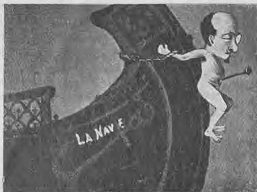
Д'Аннунціо на „Корабль“.