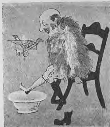
Послѣ полета на аэропланъ