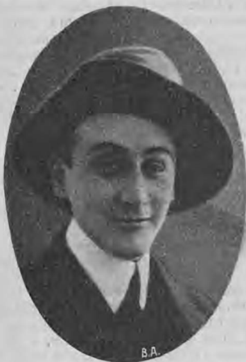
А. С. Востоковъ.