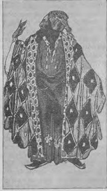
Эскизы костюмовъ по рисункамъ Бакста.

За гробомъ шла группа близкихъ, а дальше слѣдовали экипажи и извозчичьи пролетки.