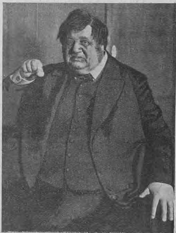
В. Н. Давыдовъ въ роли Расплюева.