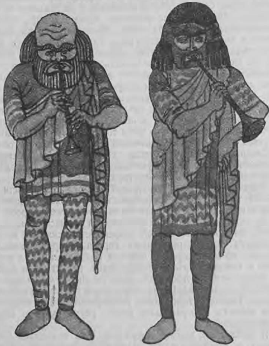
Эскизы костюмовъ. Трубачи.

займимъ, городъ снялъ тотъ-то, и трупна имъ уже давно, черезъ бюро же сформирована.