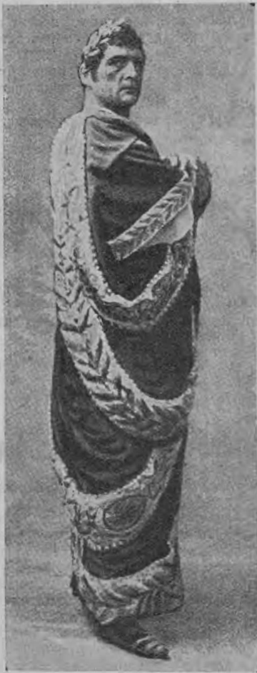
Императоръ (М. Desjardins).

недурное впечатлѣніе, вызывая смѣхъ. Бенефициантка хорошо справилась съ ролью горничной Жюли. А вотъ г. Смоляковъ—былъ однообразенъ.