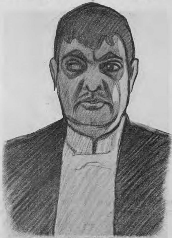
Г. Дмитріевъ — „Румынскій дирижеръ“.