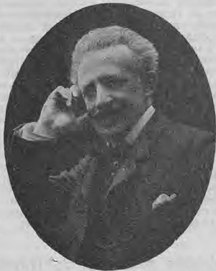
† С. Я. Семеновъ - Самарскій.

27 июля нами получено сообщеніе со станціи Абомеликово-Слободка, ж.-з. ж. д., что недалеко отъ станціи, въ поѣздѣ скоростножизно скончался извѣстный артистъ Семеновъ Яковлевичъ Семеновъ-Самарскій.