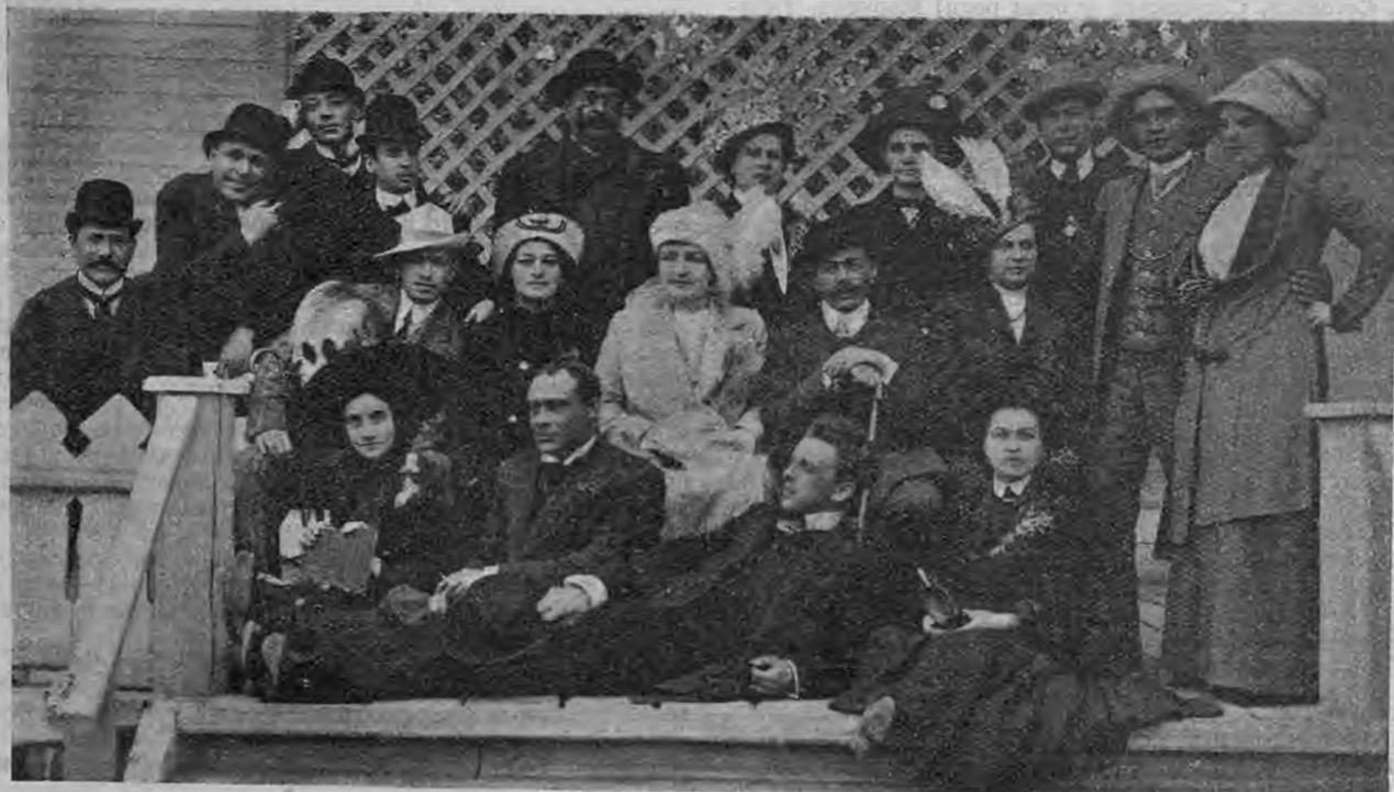
Драматическая труппа г. Викторова.