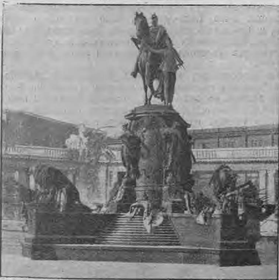
Памятникъ Вильгельму I въ Берлинѣ.