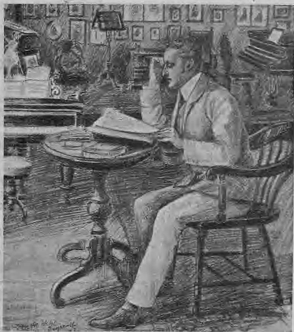
Рихард Вагнеръ въ молодости.