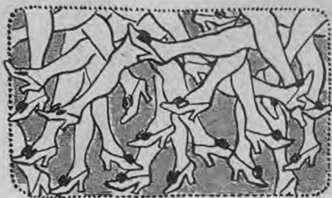
„Итоги лѣтняго сезона“.

Пьеса же „За рѣчкой“, какъ вамъ достовѣрно извѣство, еще никѣмъ не написана.