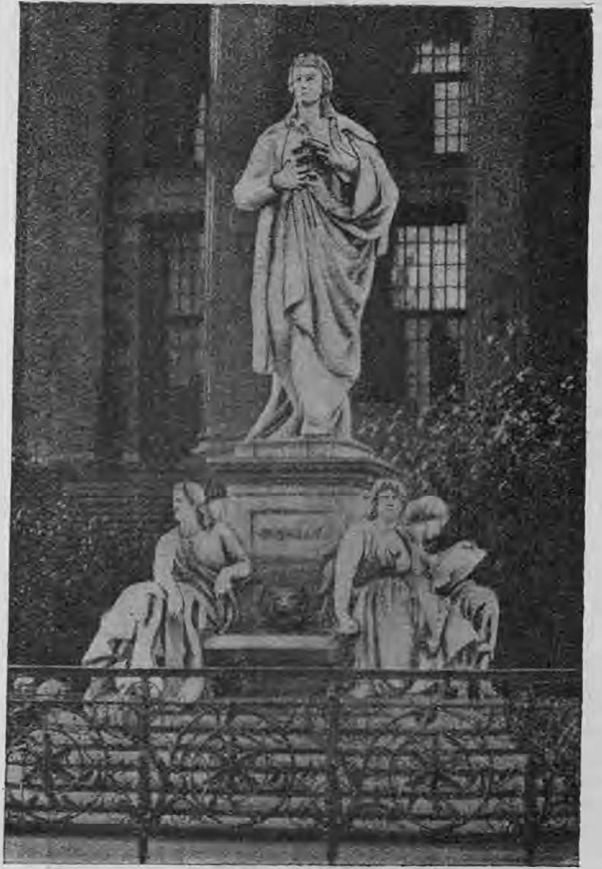
Памятникъ Фр. Шиллеру въ Берлинѣ.

муха“, въ которой выступали г-жи Садовская, Чижевская гг. Далматовъ, Петровскій и К. Яковлевъ.