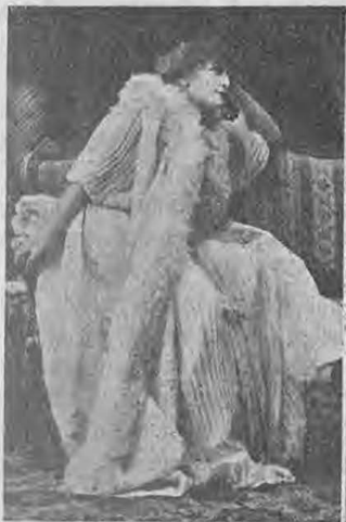
„Дама съ намеліяки“.