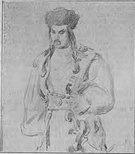
Посоль Мамай — г. Чабровъ.