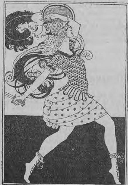
Е. Э. Крюгеръ — Генiй Бельгiи.