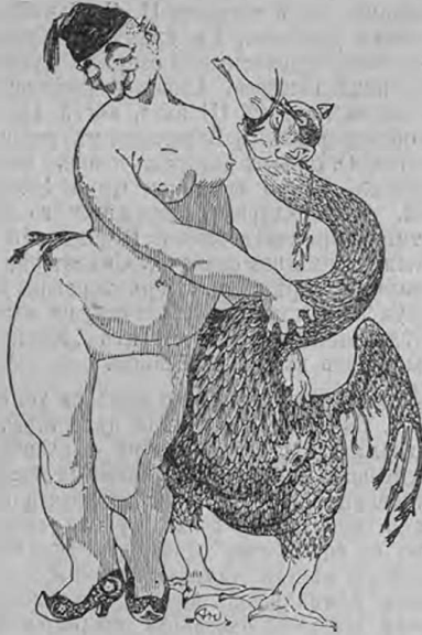
Леда и Лебедь.