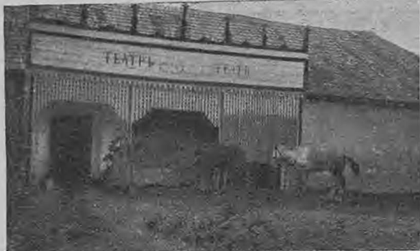
Театръ нурорта Буски, превращенный въ «монюшню русской кавалеріи».