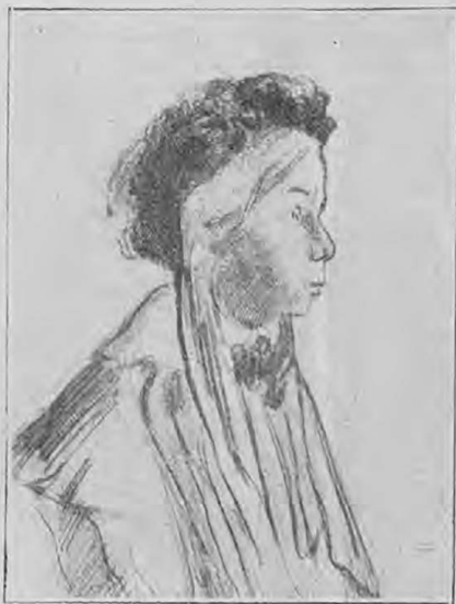
Ихменева — О. П. Нарбекова.