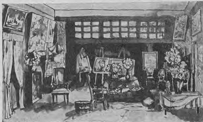
Эскизъ декораціи 2-го акта.