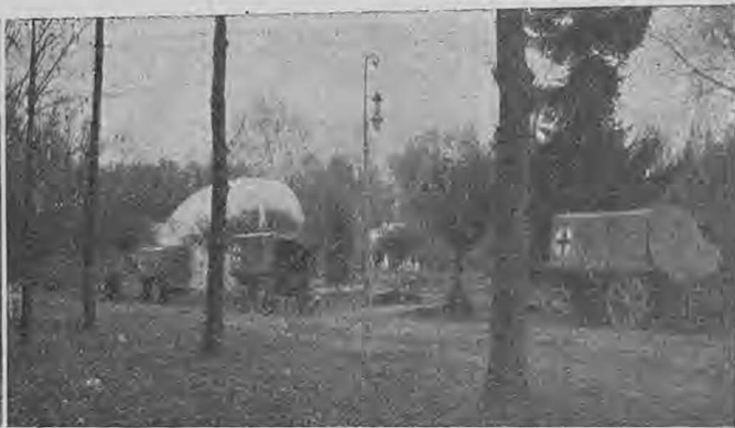
Паркъ нурорта Буски, занятый «Краснымъ Креотомъ».