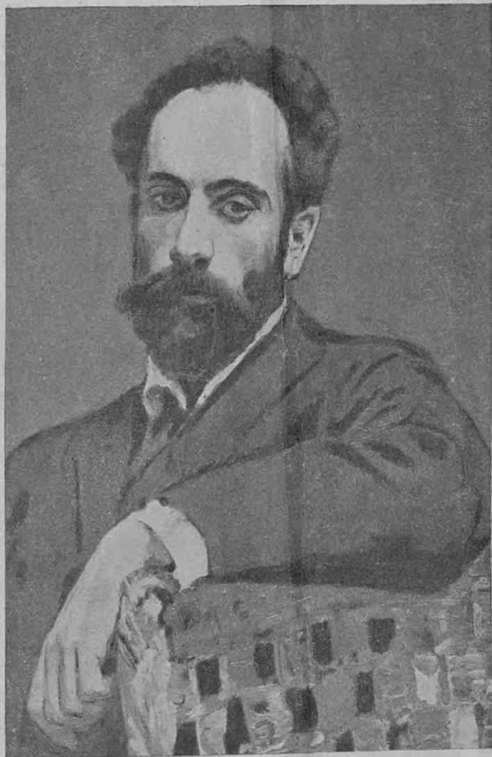
И. И. Левитанъ.