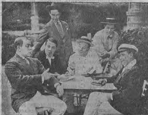
Чинаровъ платитъ жалованье...