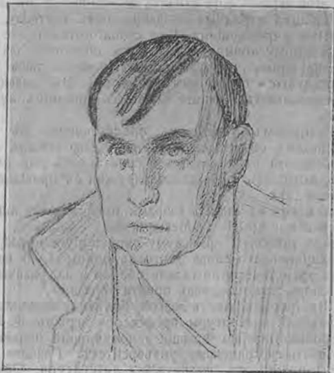
Наполеонъ — М. М. Петипа.