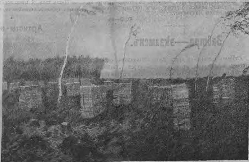
И. Левитанъ. Буря.

„Черезъ слово человекъ обращается мыслью, черезъ образы и искусства онъ обращается чувствами со всѣми людьми не только настоящаго, но и прошедшаго и будущаго“, — говорить Левъ Николаевичъ Толстой.