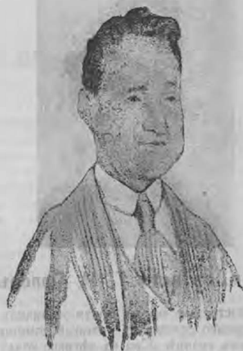
Но духомъ смирился онъ скоро,— И бороду сбрилъ навсегда!