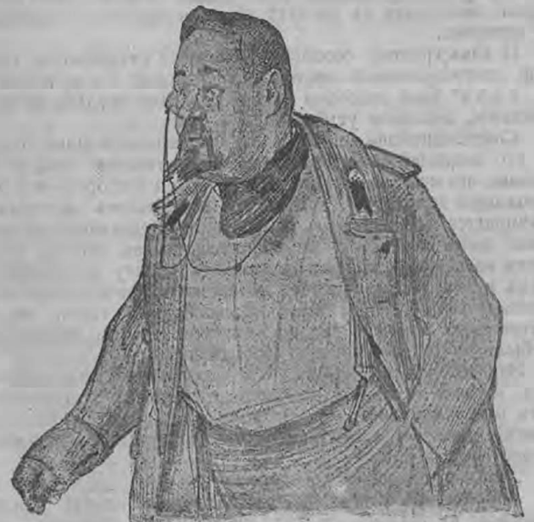
Телемаховъ—К. Н. Яковлевъ.

Гастроли артистовъ Александр. театра въ Москвѣ. „Профессоръ Сторицынъ“.