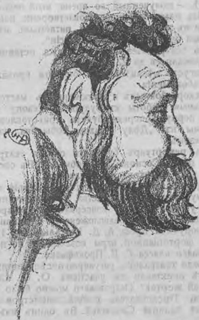
Громить Яблоновскій актера... Во гнѣвъ тряслась борода.