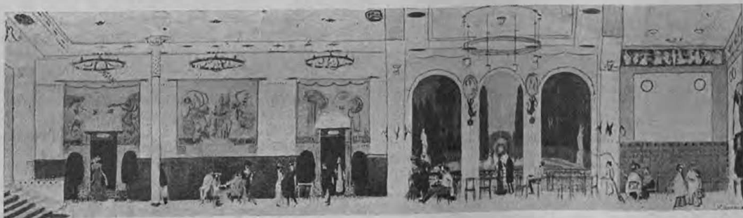
„Кафѣ“. Архит. мотивъ Н. А. Эйхенвальда.