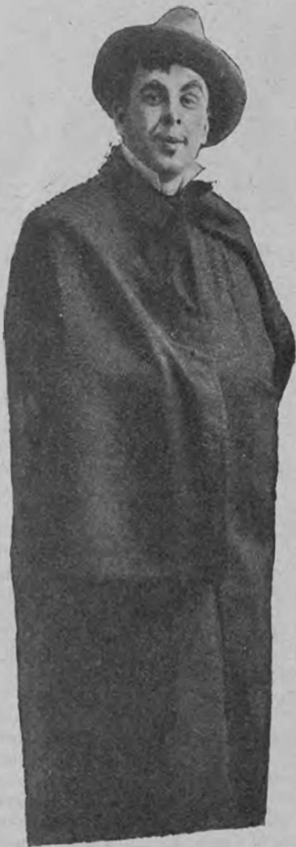
Васенинъ (Неизвѣстно какой человекъ).

„Театральный разъѣздъ“ на сценѣ Малаго театра.