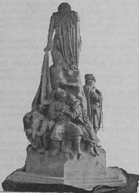
Проектъ памятника Гоголю, работы А. П. Ленскаго.