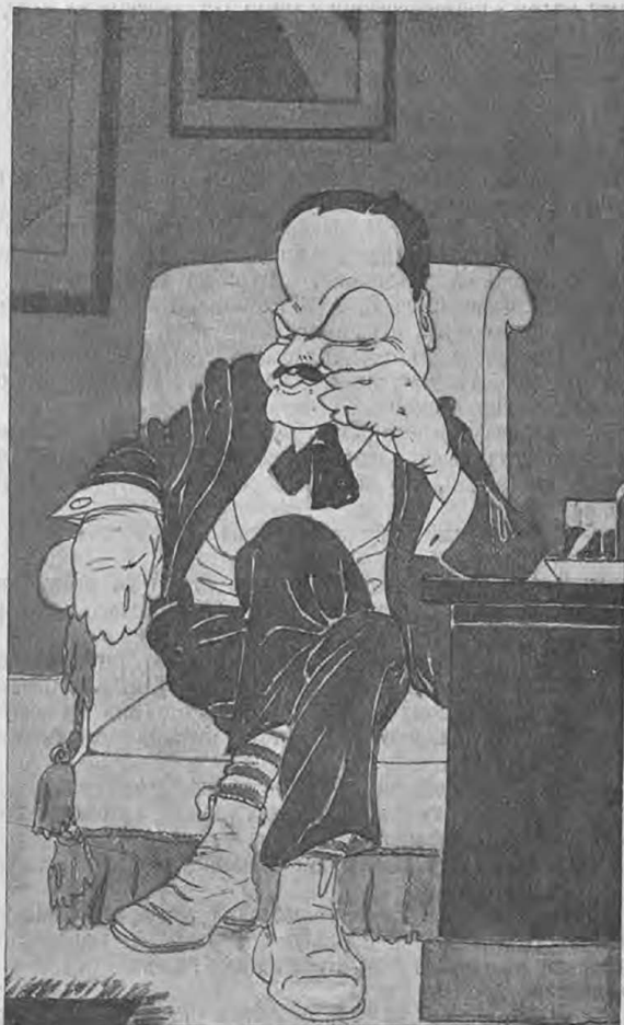
В. А. Теляковскій.