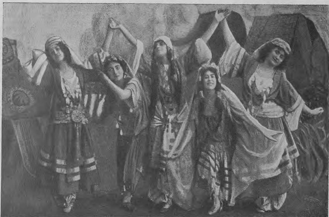
Танецъ половецкихъ женщинъ.