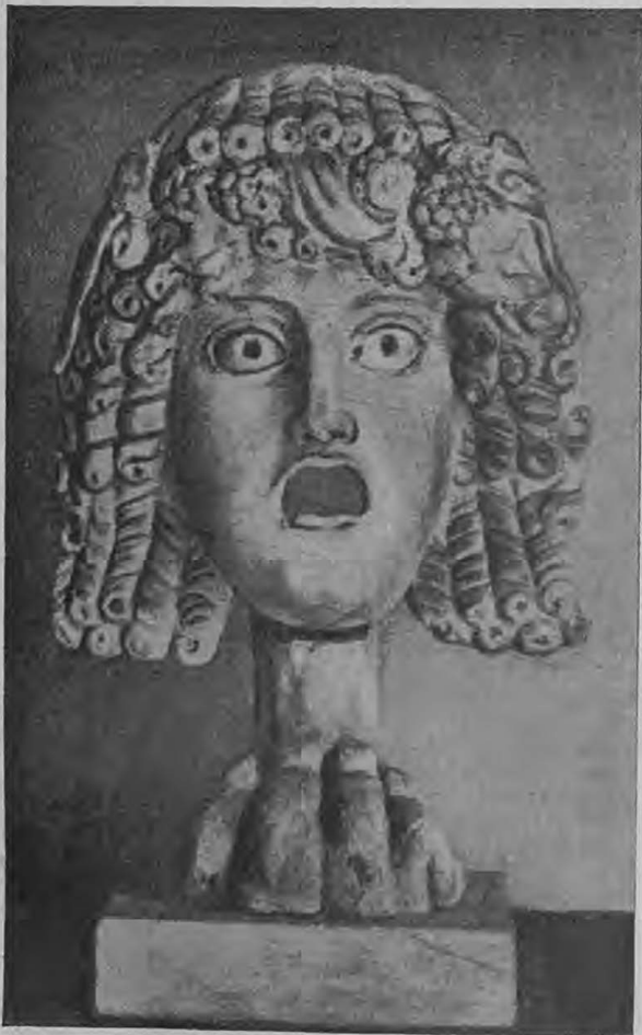
Греческая театральная маска изъ мрамора.