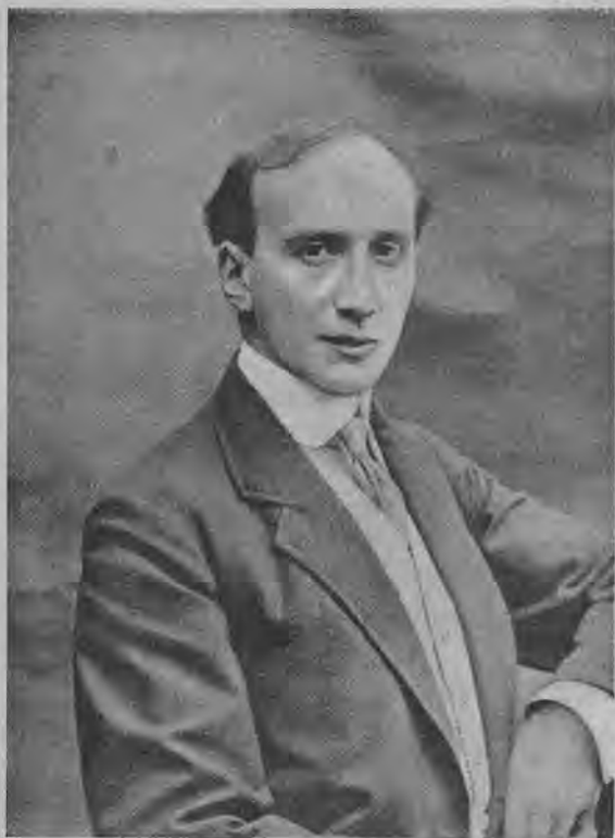
Анри Батаиль, известный драматург, автор „Неразумной Дѣвы“.

цузские драматурги считают, что критика—совершенно излишняя роскошь, разъ она не хвалит огуломъ, разъ она смѣетъ „критиковать“. Не прошло нѣсколькихъ дней, послѣ появленія въ „Comœdia“ письма Жака Ришпена къ Бриссону, какъ на страницахъ той же газеты появилось опять открытое письмо Бриссону, подписанное авторами новой пьесы, поставленной въ театрѣ Варьетѣ „Le Bois Sacré“ — де-Флерсомъ и Кайавэ.