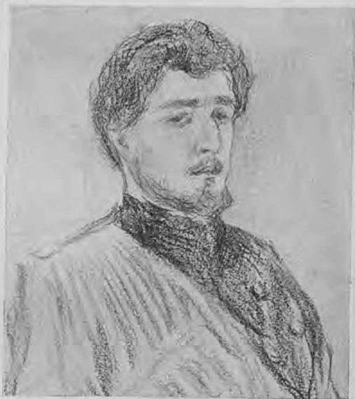
Эрекле — г. Пикокъ.