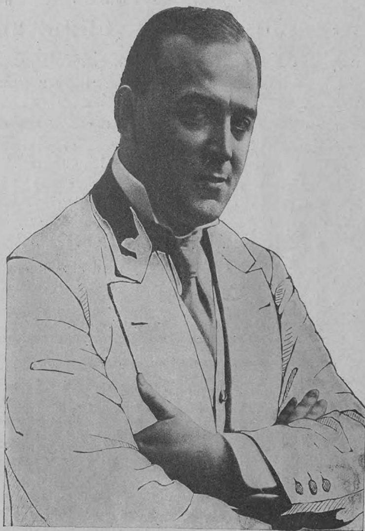
Л. В. Собиновъ.

Заслуженный артистъ Императорскихъ театровъ.