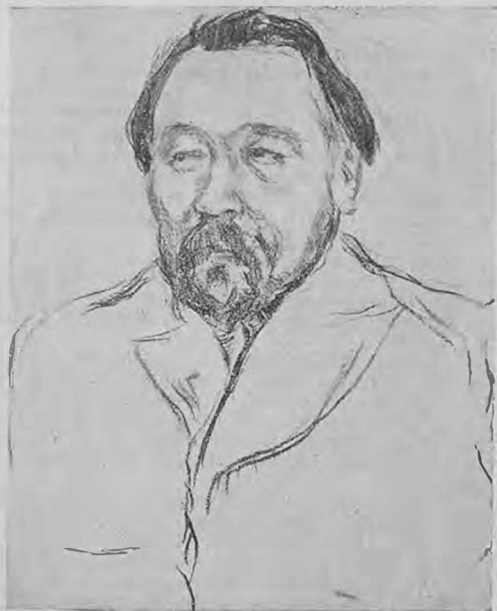
М. М. Ипполитовъ-Ивановъ.

(Изъ постановки „Измѣны“ у С. И. Зимина.)