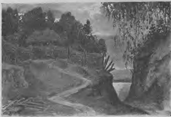
Эскизъ декораціи 4-го акта.