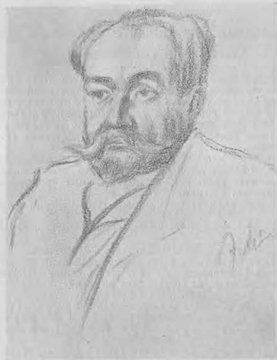
Засѣка — г. Рыбаковъ.