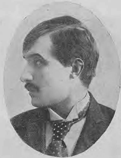
Датскій писатель Германъ Бангъ, гостящій въ Москвѣ.

Поэтому она не прижимается, не затягивается, не выдѣ- вастъ париковъ. Она носитъ костюмъ роли; но она оставляетъ свободнымъ свое существо, какъ свободный инструментъ для создающей воли, которая превращаетъ ее изъ Марга- риты въ Сантуццу и изъ Сантуццы въ Мирандоллину. Но для того чтобы Дузе могла пренебрегать тѣми ничтожными сред- ствами, которые помогаютъ другимъ, она должна давать не- обыкновенный подъемъ. Для созданія такого же удивитель- наго существа, Элеонора Дузе обладаетъ безграничнымъ да- ромъ воспроизведенія. Другіе сердятся, пугаются, вос flame- няются и ужасаются. Дузе думаетъ. И только потому, что у