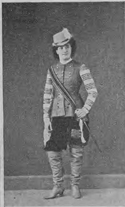
Керубино въ „Свадьбѣ Фигаро“ (1863 г.).