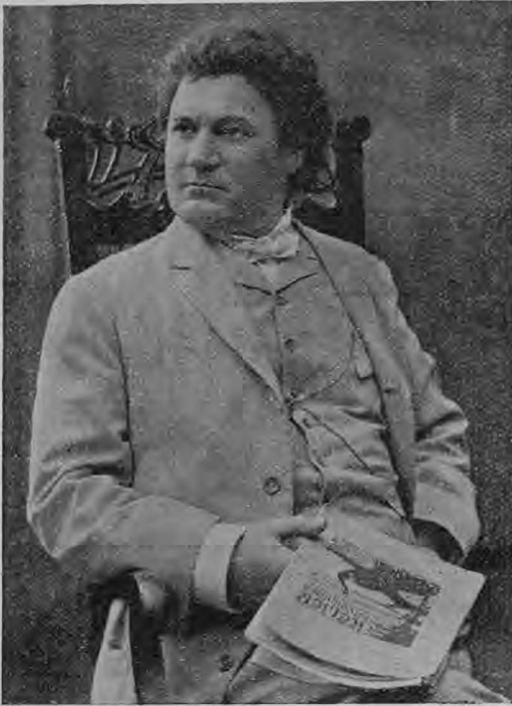
К. И. Михайловъ-Стоянъ.

Въ этомъ году исполняется тридцатилѣтне артистическое дѣятельности пѣвца-тенора К. И. Михайлова-Стоянъ, въ свое время имѣвшаго въ Россіи громадный кругъ поклонниковъ. Самый расцвѣтъ его славы былъ въ то время, когда онъ пѣлъ въ Москвѣ въ частной оперѣ Прянишниковъ, гдѣ онъ создалъ роль Капіо въ „Паяцахъ“ и въ Большомъ театрѣ. До сего времени, несмотря на свой почтенный возрастъ (60 лѣтъ), артистъ обладаетъ прекрасно сохранившимся голосомъ и поразительной техникой, что онъ несомнѣнно доказалъ, выступая въ послѣднее время въ Москвѣ, въ благотворительныхъ концертахъ, въ этнографическихъ засѣданіяхъ и въ собраніяхъ женскаго клуба.