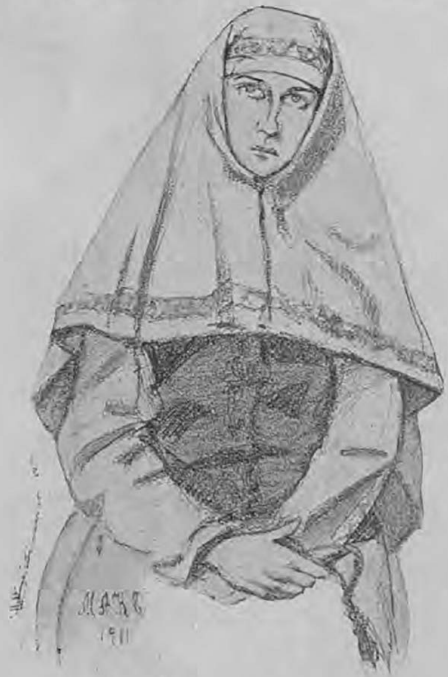
Настя — г-жа Буткова.