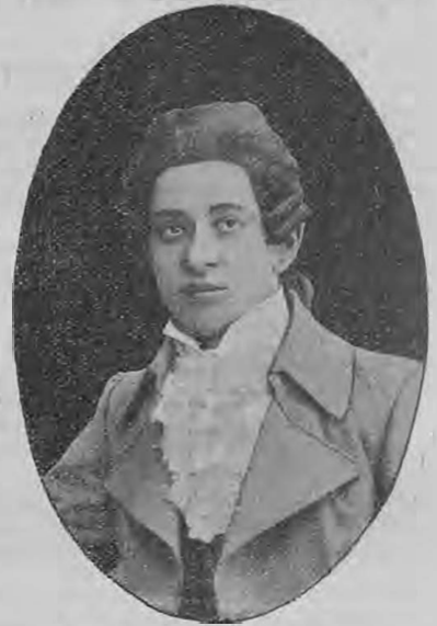
Д. Т. Саяновъ. (Къ 10-лѣтнему юбилею.)