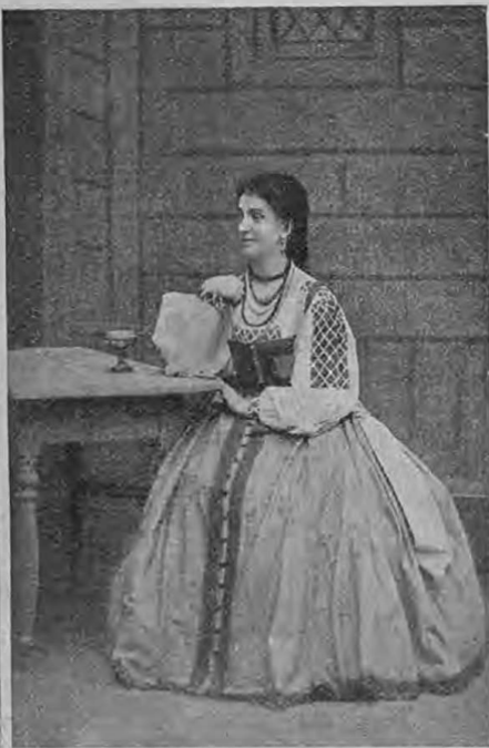
Глаша въ „Каширской Старинѣ“.