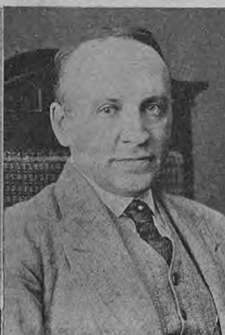
В. Р. Гардинъ. Артистъ и режиссеръ.