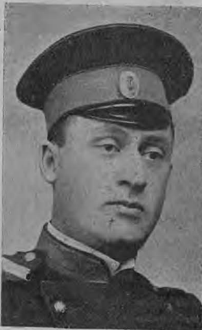
И. А. Ватинъ. Драм. артистъ.