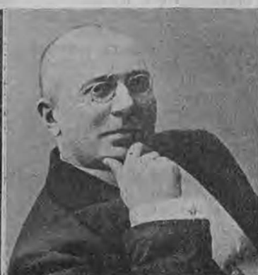
А. К. Каренинъ.