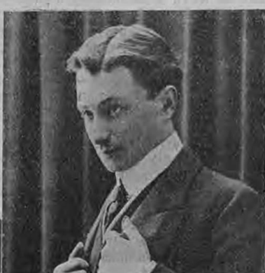
Г. С. Ермоловъ.