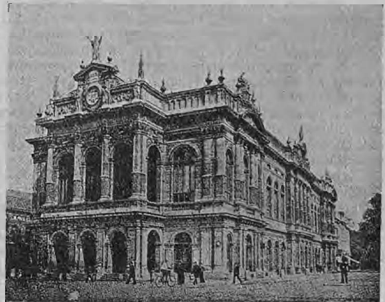
Фламандскій театр въ Антверпенѣ, разрушенный нѣмцами.

Книгоиздательство К. Ф. Некрасова очень ко времени выпустило книгу Ф. Сарсе „Осада Парижа въ 1870—71 г.“ Увлекательно написанная, занимательная, какъ романъ, значительная, какъ правдивая картина жизни великаго города, пережившаго суровые дни осады, — эта книга не утратила своего живого интереса и по сію пору. Даже болѣе: именно теперь, когда судьба привела народы Европы въ сграшную борьбу, записки Сарсе приобретаютъ какой-то особый смыслъ; словно онъ не о томъ, что было когда-то, а о самомъ недавнемъ, только что пережитомъ, о самомъ современномъ. Читаешь эту блестящую хроникку, эту сверкающую умомъ и талантомъ стилиста повѣсть о дняхъ осады Парижа, и какъ ярко представляешь себѣ возможность той опасности, которой теперь