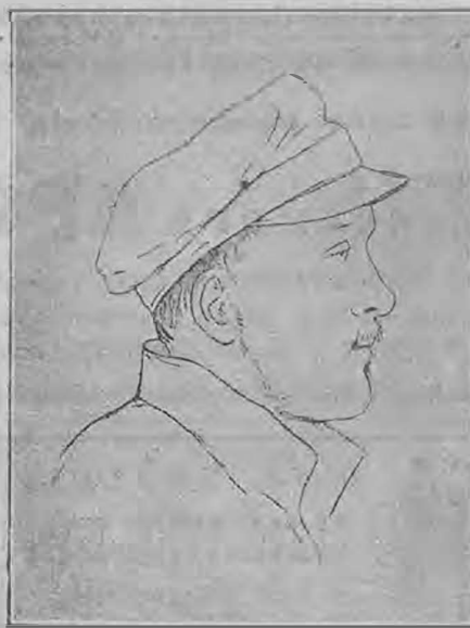
М. Ю. Лермонтовъ въ іюль 1840 г.

Тяжело видѣть и говорить съ ними. Хотѣлось плакать вмѣстѣ со старикомъ, три года ищущимъ свою могилу, и хотѣлось ругать, бить театральную громаду за ея безпечность.