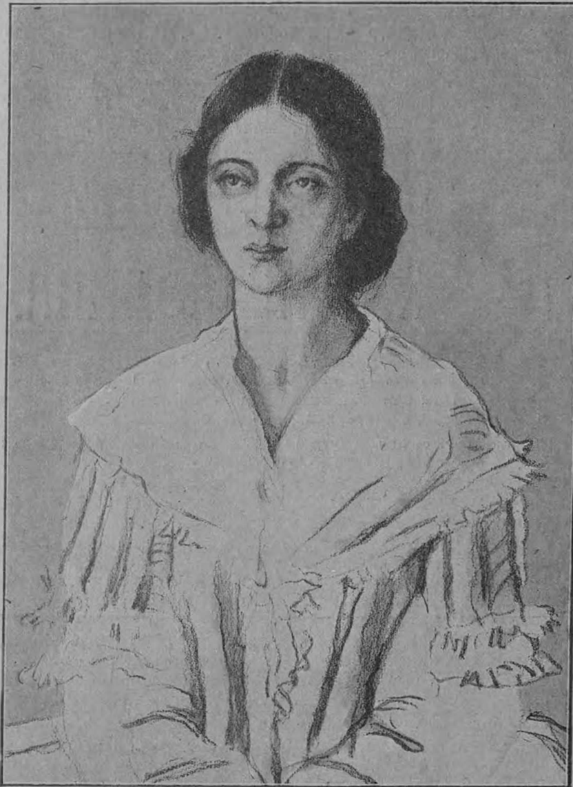
Е. А. Полевицкая въ роли Лизы („Дворянское гнѣздо“.)