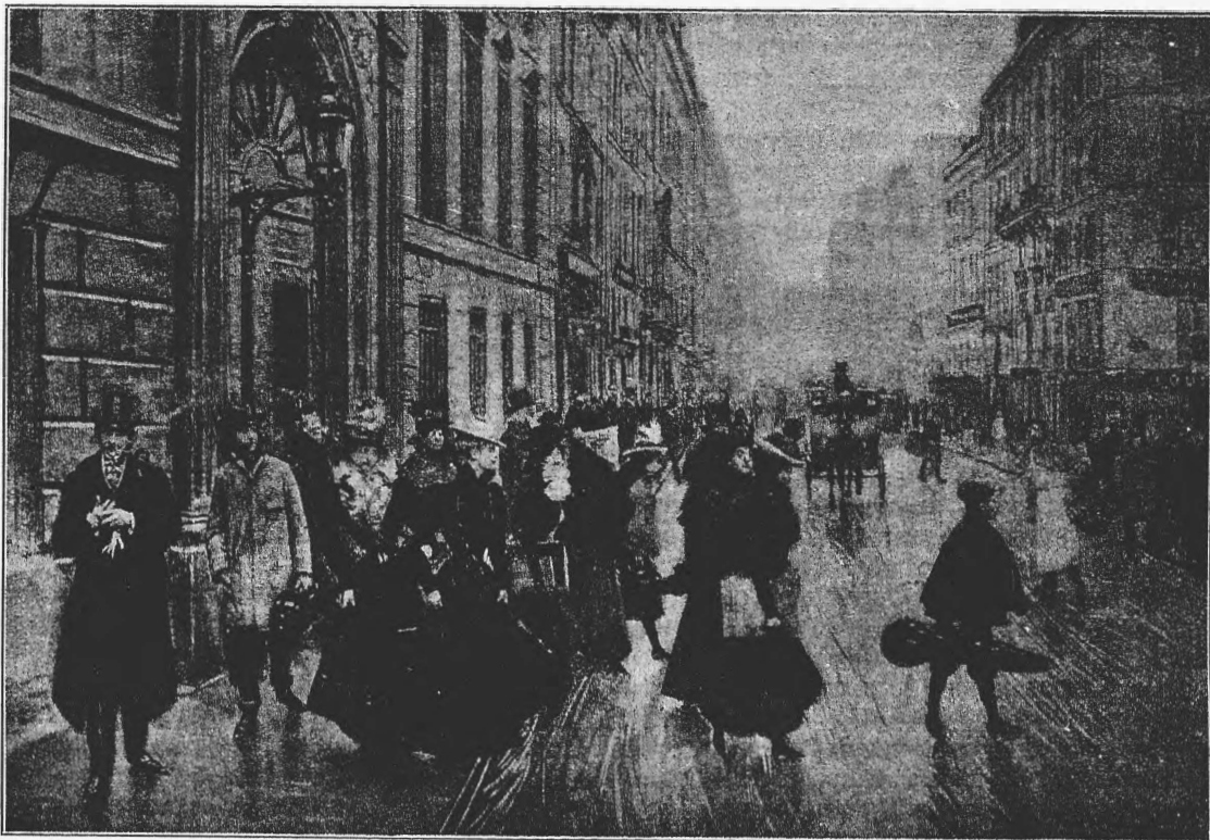
При выходѣ изъ консерваторіи.