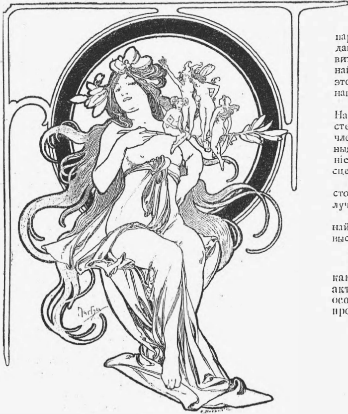
Афиша Bal de quat'z arts. (Работа Муха).