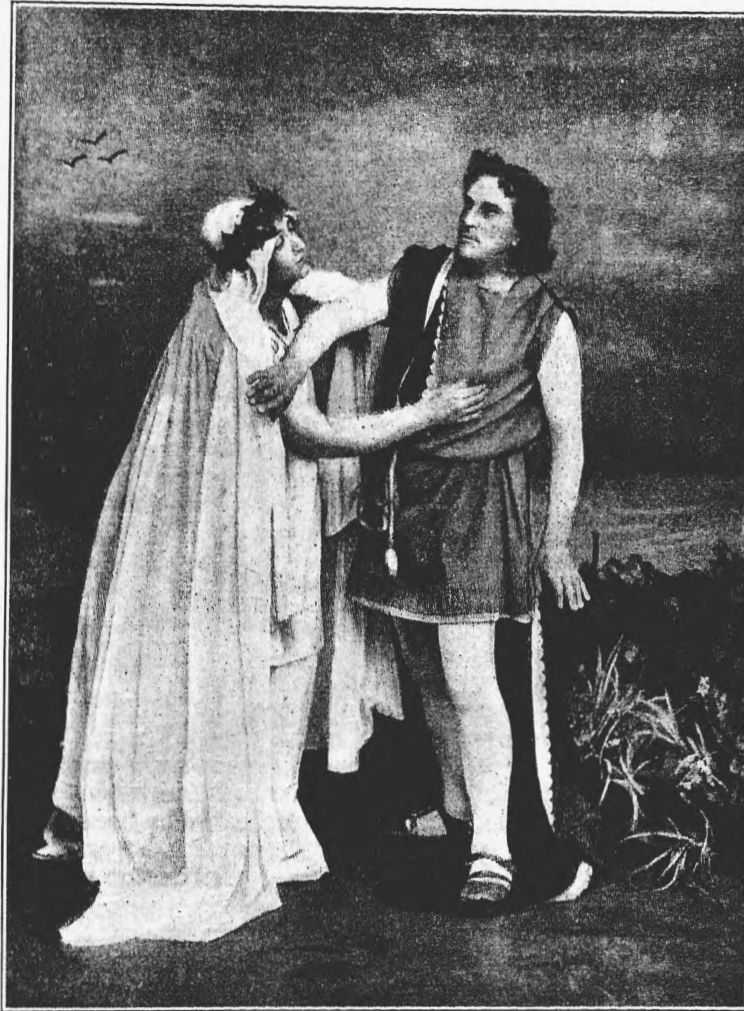
«Ифигенія» на Берлинской сценѣ.

Существуетъ, правда, истерическій плачъ, сопровождаемый смѣхомъ, но тамъ плачъ и смѣхъ периодически чередуются между собою, хотя очень быстро, но все же не одновременно.