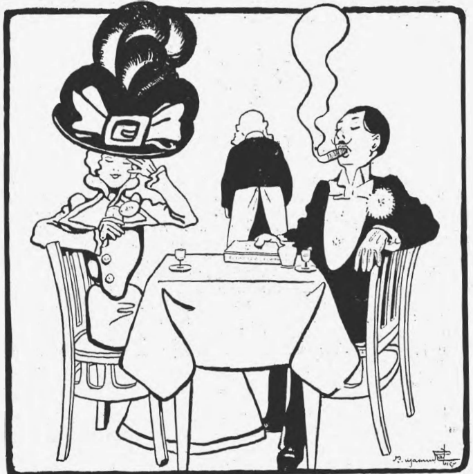
Въ Лѣтнемъ саду.

Какъ же быть? Какъ заставить психо-физическую сферу дѣйствовать въ соотвѣтствіи съ волей художника, съ образомъ, возникшимъ въ его душѣ? Для этого нельзя указать отдѣльно и разомъ дѣйствующаго приема, зато можно прибѣгнуть къ воздѣйствію постоянно-реагирующаго на субъекта средства: къ соотвѣтственной психо-физической гимнастикѣ . Гимнастика эта, состоящая въ разрѣшеніи различныхъ, но приведенныхъ въ систему психическихъ