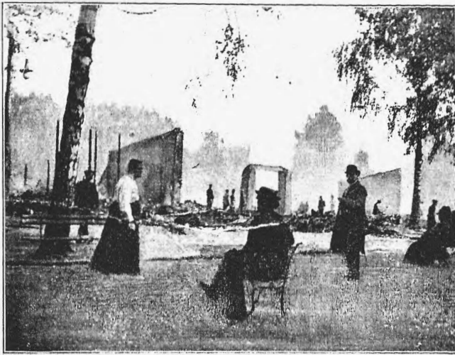
Московскій садъ «Альгамбра» послѣ пожара.

нѣсколько разъ «тушь». На-дняхъ, во время исполненія этого нумера «женщина-геркулесъ», уставъ, вѣроятно, отъ предъдущихъ упражненій, сдѣлала одно неловкое движеніе, платформа покачнулася и, по словамъ «Сар. Дн.», обрушилася на несчастную женщину вмѣстѣ со стоявшими на доскѣ солдатами. Немедленно принялись вытаскивать гимнастку изъ-подъ доски. Занавѣсъ опустили, и даже среди безпечныхъ посѣтителей «вокзала» пронесся ропотъ негодованія. Черезъ минуту пострадавшая вышла на сцену и, принужденно улыбаясь, раскланялася съ «почтеннѣйшей публикой». «Нумеръ», однако, не былъ продолженъ.