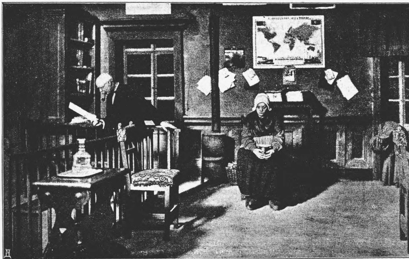
«Гибель Надежды». Драма Хейермана.