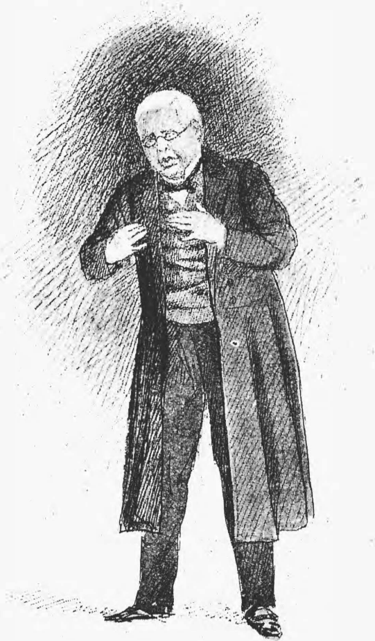
«Игроки». Гловъ старшій.