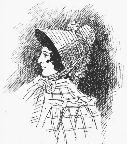
«Дама просто пріятная».

— Не знаю, ничего не знаю, господа, пожималъ