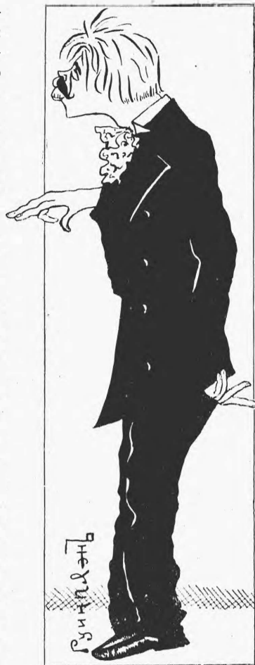
Штокмакъ. «Самый сильный человекъ тотъ, кто стоитъ одиноко».