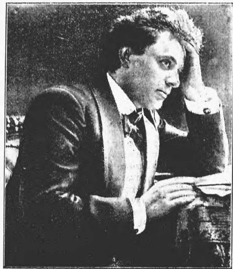
Артистъ Больш. моск. театра г. Южинъ.