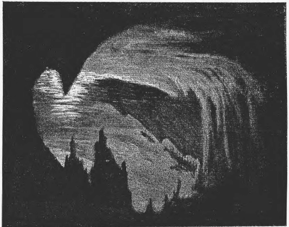
«Пелей и Мелисанда»