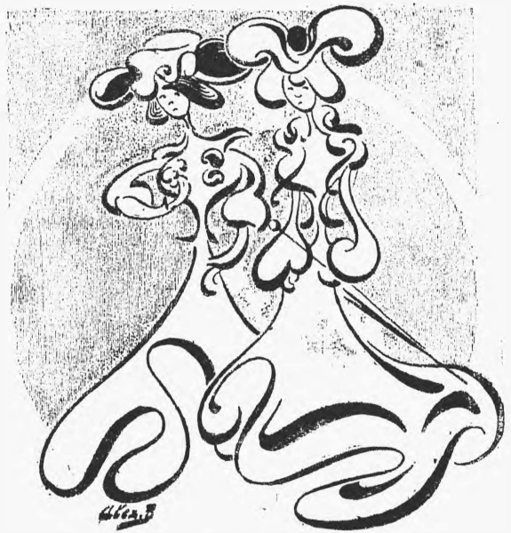
«Пара новѣйшихъ ingénue».

Въ-четвертыхъ. Убійца былъ не инженеръ-путеецъ и даже не тепоръ, а «учитель арабскаго языка, очевидно страдающій мапией преслѣдованія» (какая страшная профессія!).