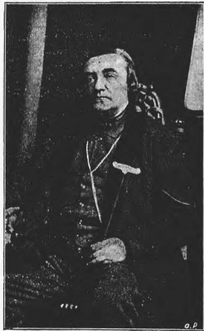
П. М. Садовскій

Въ «Аркадіи» гастролировала Л. Б. Яворская. Были поставлены: 14-го—«Дама съ камеліями», 15-го—«Карьера Наблочнокаго», 16-го—«Карьера Наблочнокаго» (2-й разъ), 17-го «Фру-Фру». Какъ играетъ г-жа Яворская эти роли—едва ли нужно говорить. Парижъ артистку, разумѣется, ничему не научилъ. Приведу только цифры сборовъ за время гастролей г-жи Яворской. Это—лучшая иллюстрація. 1-й спектакль (въ воскресенье)—711 р., 2-й спектакль—330 руб., 3-й—327 руб. и, наконецъ, 4-й—303 р. На пятомъ («Усталая душа») я не былъ, но, по слухамъ, сборъ былъ еще меньшій. И это въ театрѣ, въ которомъ благодаря высокимъ цѣнамъ, полный сборъ болѣе, чѣмъ 1300 р. Гастроли должны были продолжиться еще нѣсколько дней, но «по болѣзни» г-жи Яворской внезапно прекратились. «Болѣзнь», во всякомъ случаѣ, современная, ибо, если бы сборы уменьшались въ той же пропорціи, въ какой они падали въ первые спектакли, то, пожалуй, пришлось бы, въ концѣ концовъ, играть при пустомъ театрѣ.