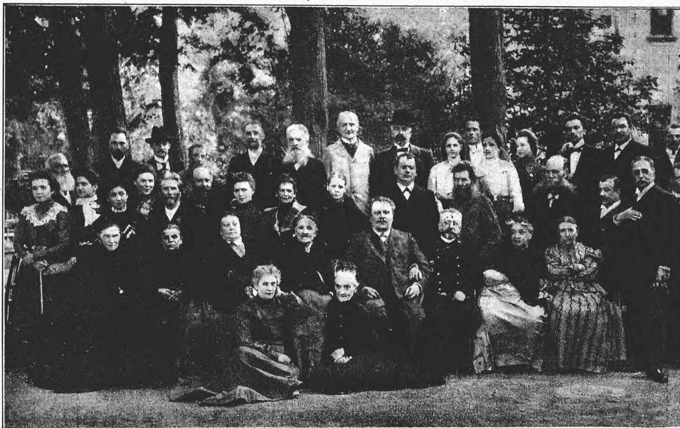
Группа пансіонероу убѣжища, членовъ Совѣта Т. О., канцеляріи и представителей печати, присутствовавшихъ на молебнѣ въ день открытія убѣжища.