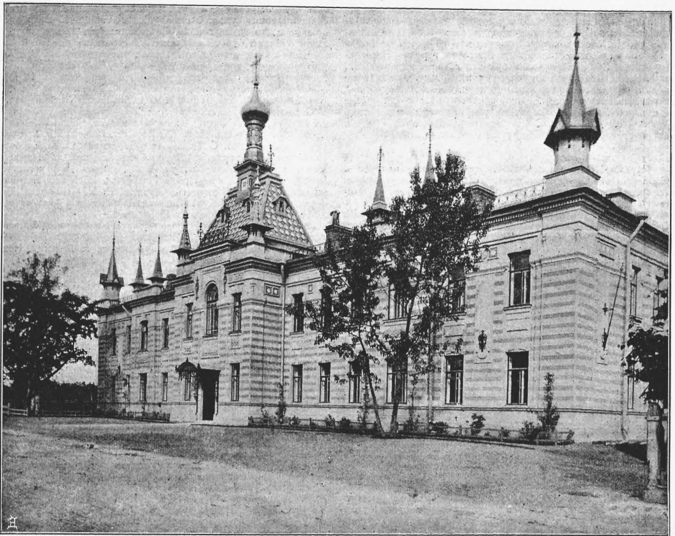
Наружный видъ новаго зданія убѣжища.