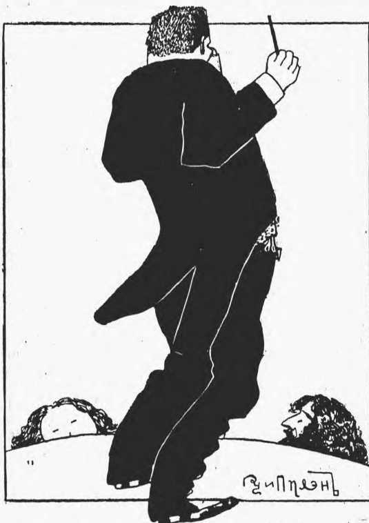
Г. Горѣловъ... дирижеръ или военачальникъ? (Шаржъ).

— Молчи. Знаю самъ, но не люблю, когда мнѣ напоминаютъ объ этомъ—подумалъ онъ, приблизился къ скелету и, оттянувъ указательнымъ пальцемъ нижнюю челюсть на пружинѣ, пустил ее. Хорошо подобранные зубы сухо щелкну-