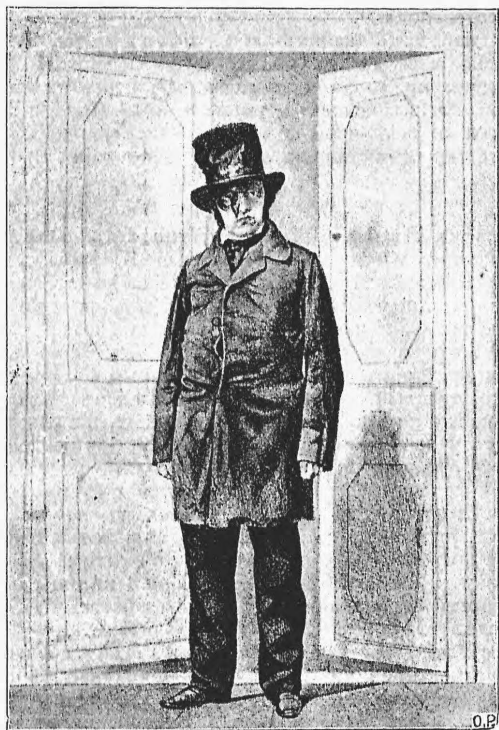
П. М. Садовскій въ роли Расплюева.