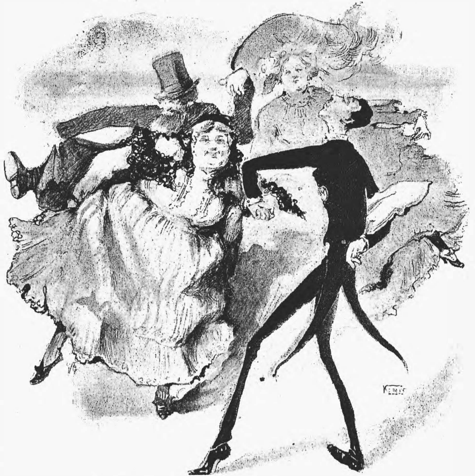
Обозрѣніе «Нашъ городъ»: Танцы на тоняхъ.