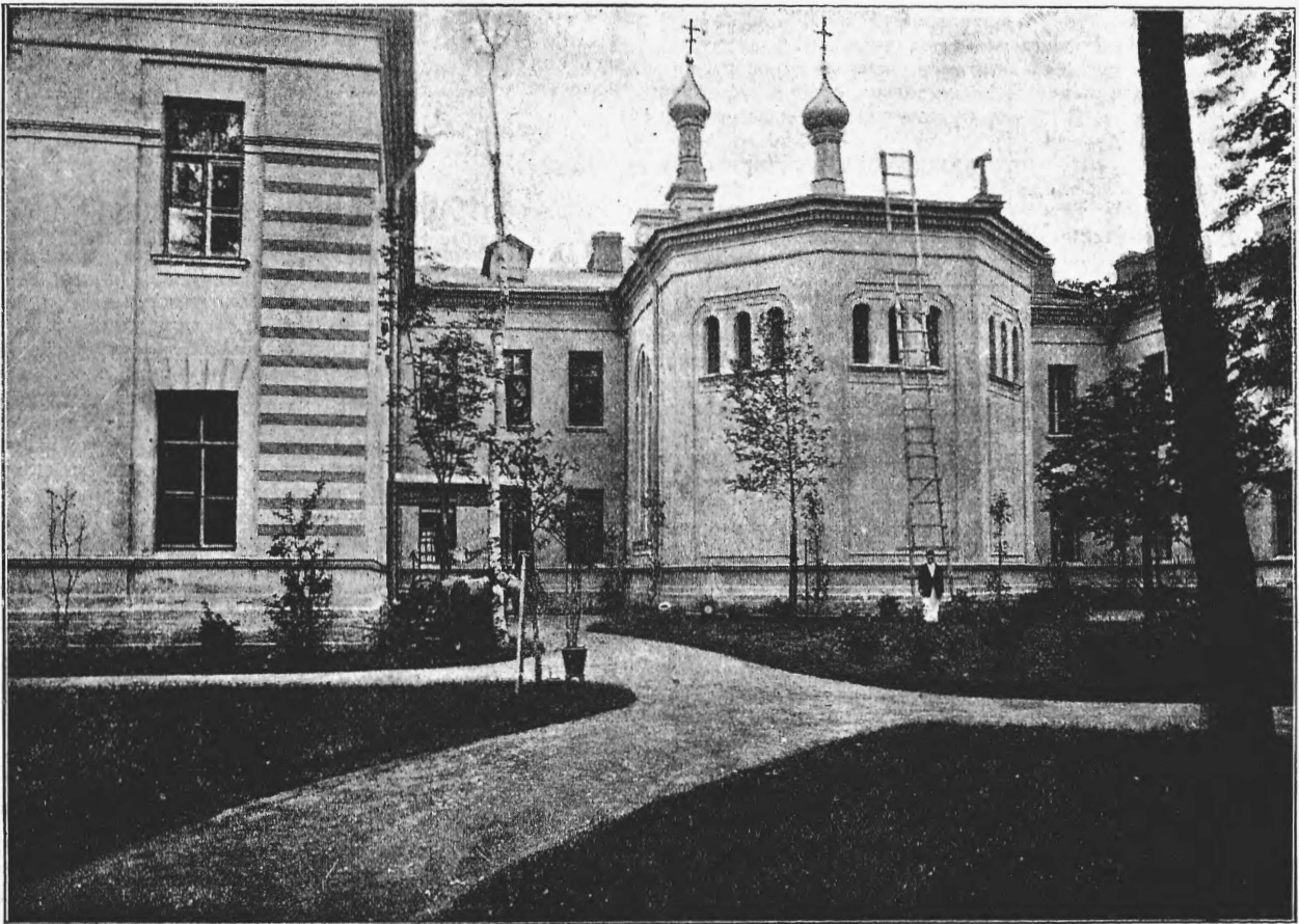
Видъ новаго зданія со двора.