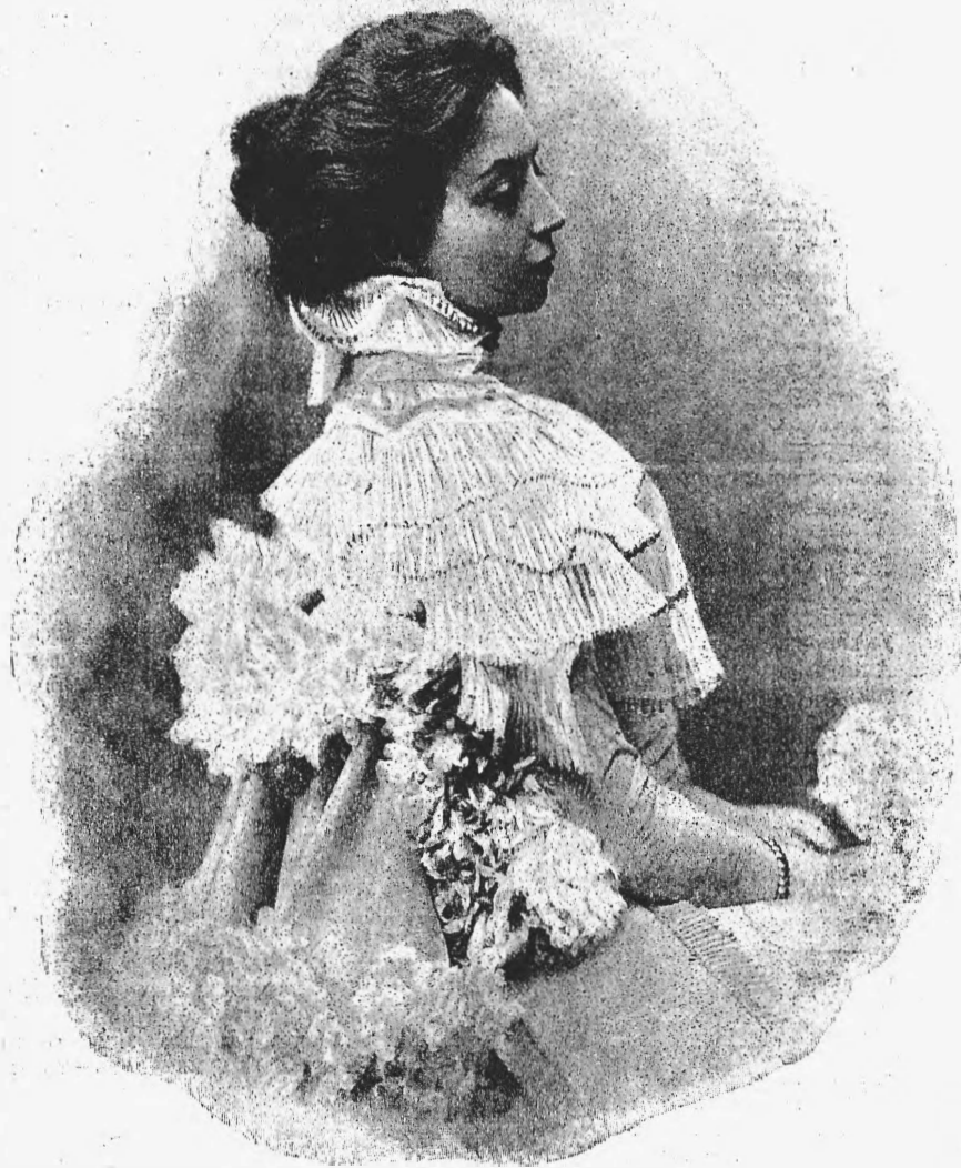
В. О. Коммисаржевская.

И затѣмъ: «Предприниматель въ случаѣ беременности артистки, имѣетъ право или прекратить ей жалованье съ того дня, когда признаки ея болѣзни становятся очевидными для зрителей, оставивъ ее на службѣ, но освободивъ отъ исполненія служебныхъ обязанностей, или же вовсе нарушивъ договоръ.»