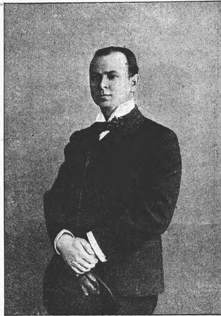
Ю. Э. Озаровскій.