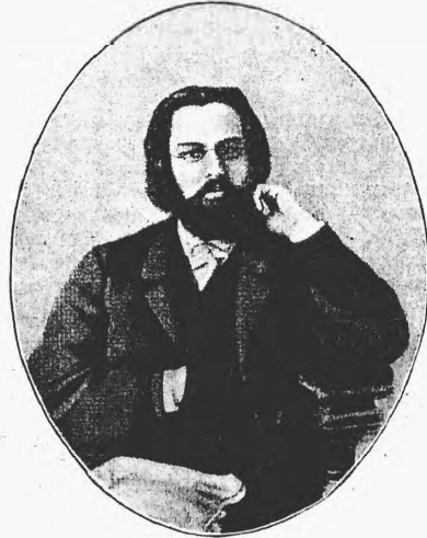
В. А. Слѣпцовъ. (Къ 25-лѣтію смерти).