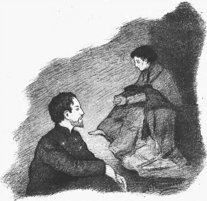
«Лебединая пѣсня», Е. Безпятава. Сцена 2 акта.

ТЕАТРЪ ЛИТЕРАТУРНО-ХУДОЖЕСТВЕН. ОБЩЕСТВА.