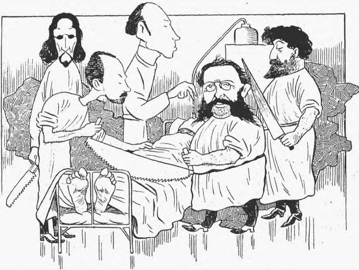
«Лебединая пѣсня» рецензентской хирургіи великопостнаго сезона.