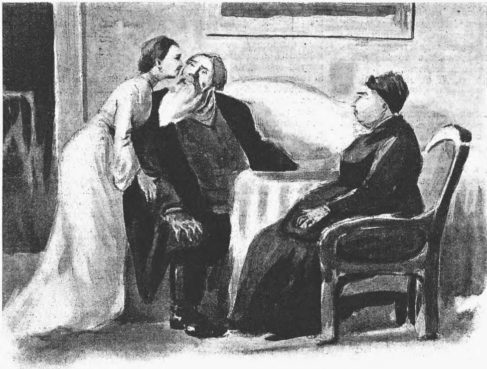
„Не все коту масленица“, 2-й актъ.