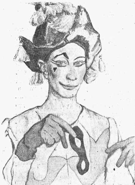
Арлекинъ (г. Гребенщиковъ).