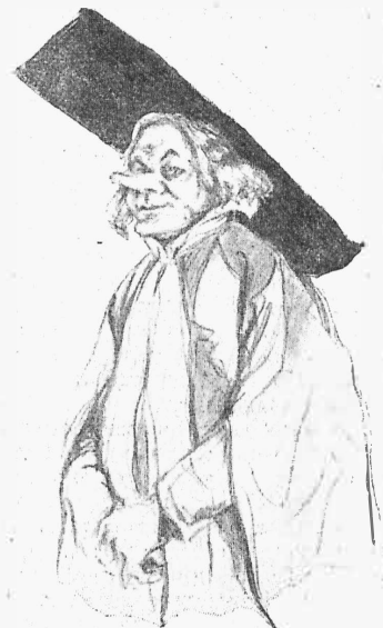
Судья (г. Вербитъ). Рис. г. Мака.