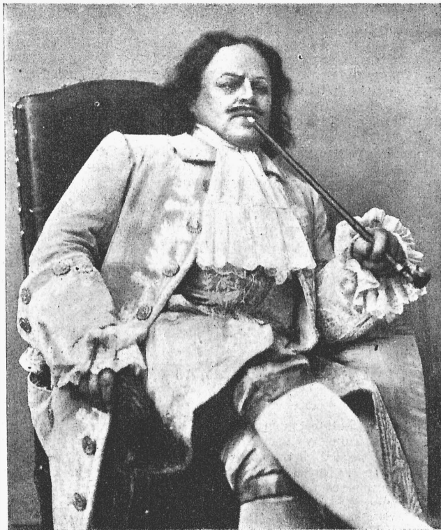
«Ассамблея», П. Гнѣдича. Петръ Великій (г. Ураловъ).

теченія слишкомъ примитивно, чтобы быть справедливымъ. Несомнѣнно, что въ консерваторской системѣ обученія, при всей ея пользѣ, есть и отрицательныя стороны, сознанныя нынче, послѣ 50-лѣтней работы. Это—вредъ, происходящій отъ однообразной нивелировки учебныхъ занятій, складывающейся къ музыкальной дрессировкѣ, почти одинаковой для самыхъ разнообразныхъ дарованій, характеровъ и познаній.