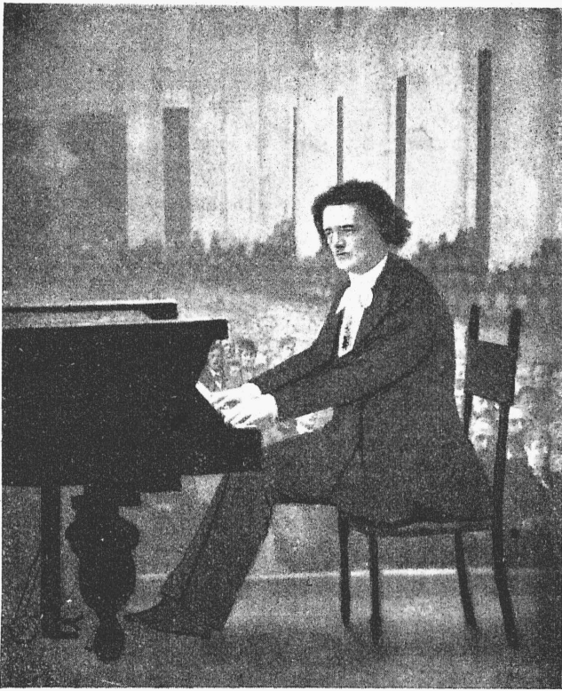
А. Г. Рубинштейнъ.

Портретъ работы Крамского—въ маломъ залѣ Консерваторіи (къ юбилею Спб. Консерваторіи).