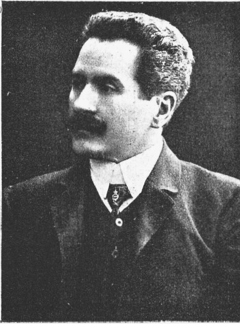
Н. Н. Фигнеръ.