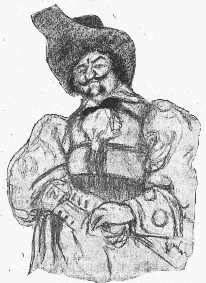
Капитанъ (г. Сухановъ). Рис. г. Мака.