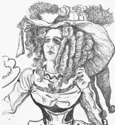
Лаура (г-жа Зборовская).