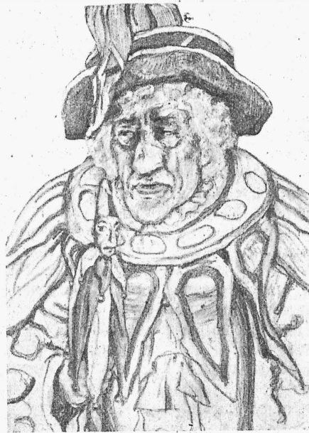
Полишинель (г. Александровскій).