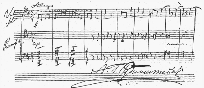
Автографъ А. Г. Рубинштейна.