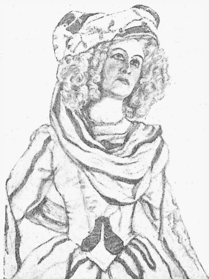
Сильвія (г-жа Вергеръ).