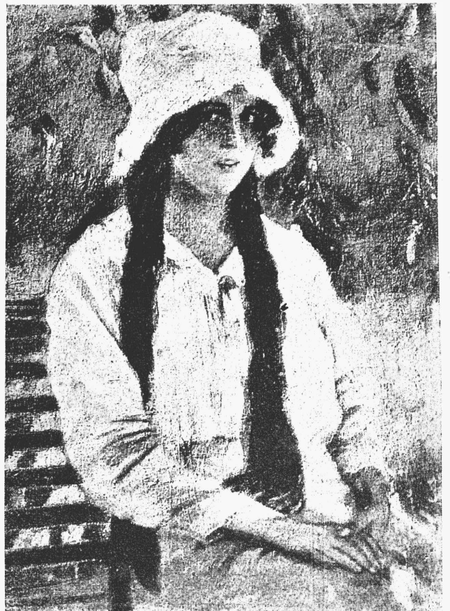
А. М. Любимовъ. — Портретъ.