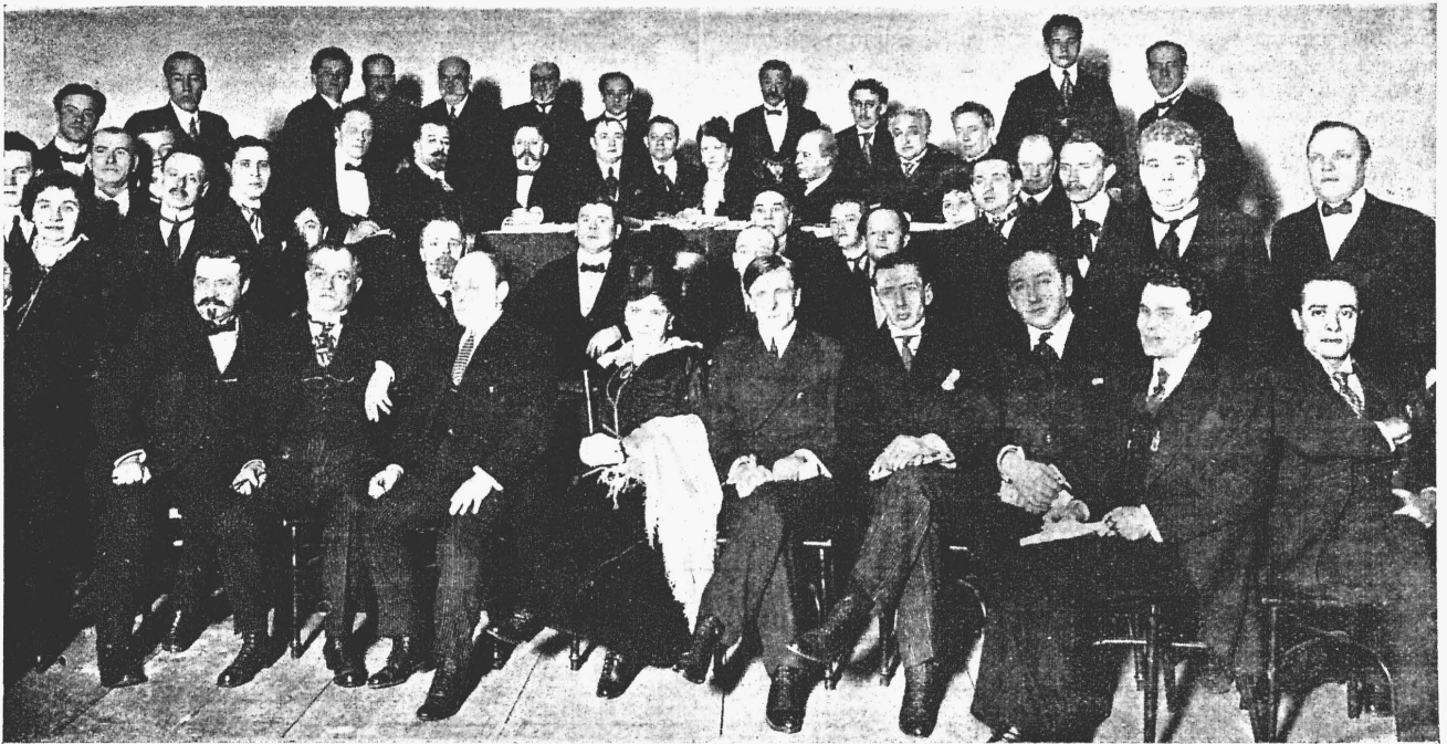
На съѣздѣ делегатовъ.

пережить всю глубину чувствъ Незнамова, повѣрить въ нихъ и увлечь ими публику.