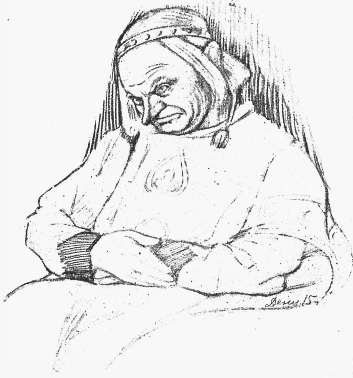
Элуа, министр (г. Нероновъ) „Король Дагоберъ“.

Позвать психіатра! Не слушайте, если вашу «рондель» закончить изъ публики такой полезный совѣтъ.