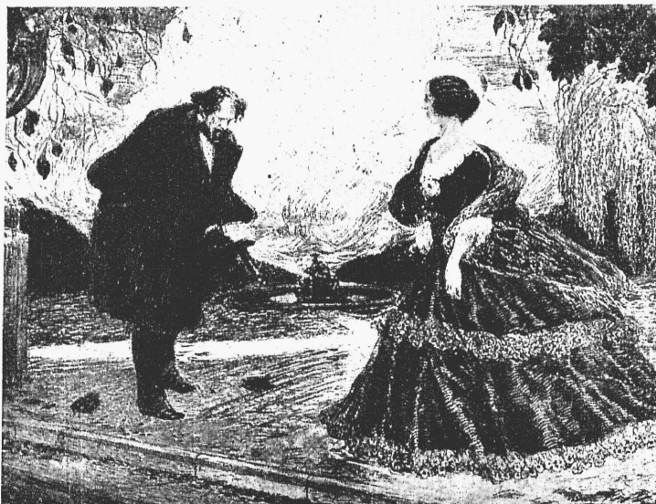
М. Соломоновъ.—«Встрѣча Жоржъ-Зандъ съ Альфредомъ де-Мюссе».

своихъ бурныхъ артистическихъ переживаній заковать въ прочныя запечатлѣваюціяся формы».