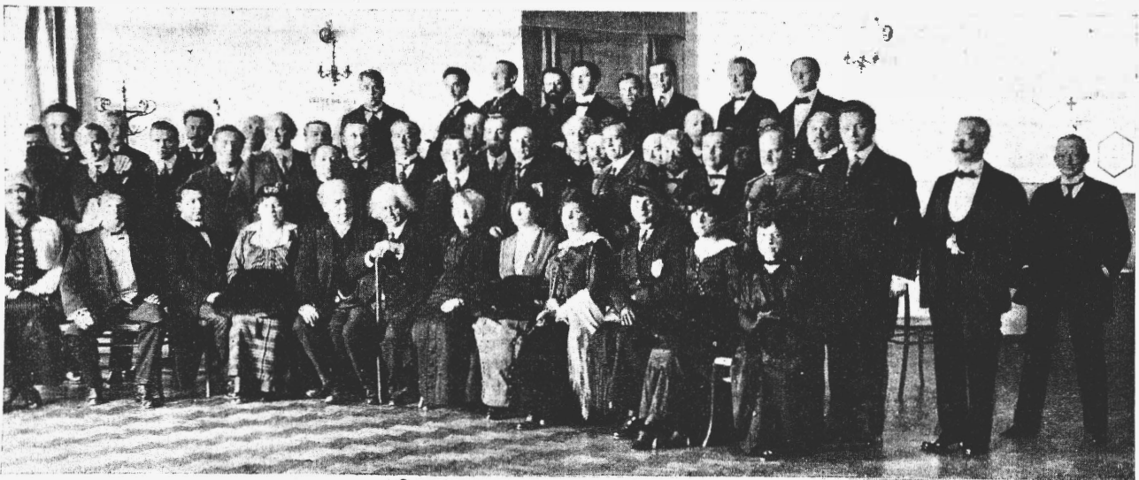
Группа членовъ Т. О. и делегатовъ, присутствовавшая на молебствіи въ помѣщеніи Бюро, въ день открытія сѣзда делегатовъ.

«Сердечно благодарю сѣздъ делегатовъ отъ мѣстныхъ отдѣловъ за выраженные чувства и пожеланія».