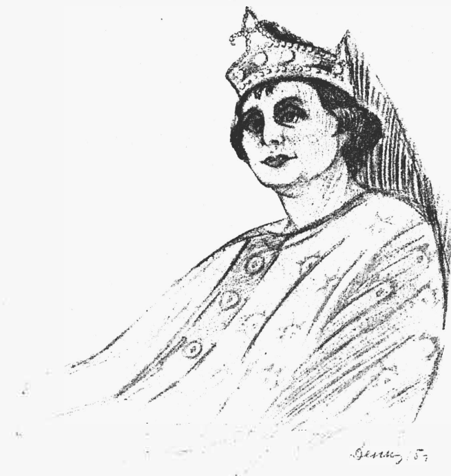
Дагоберъ (г. Лихачевъ) „Король Дагоберъ“.