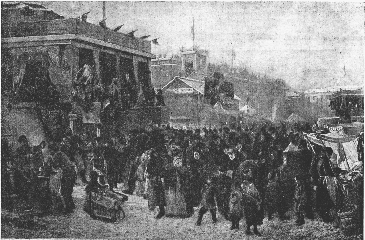
«Балаганы въ Петербургѣ».