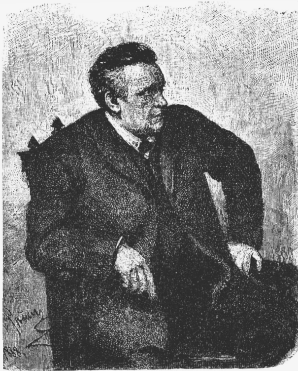
М. И. Писаревъ. (Съ портрета И. Е. Рѣпина). (Къ 10-лѣттю кончины).