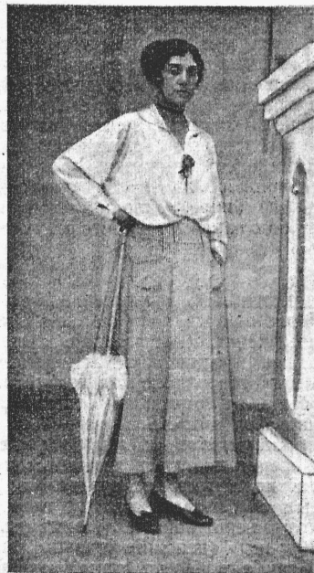
Т. П. Карсавина—въ Феодосіи.