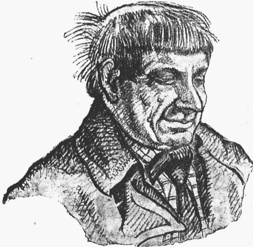
Цирюльникъ (г. Антимоновъ).