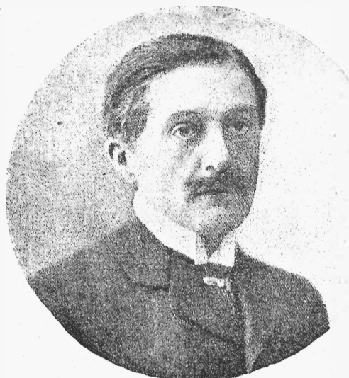
† Поль Эрвье.

*** По поводу аукціона вещей Варламова наше вниманіе останавливаютъ на томъ обстоятельстве, что снятіе съ аукціона многихъ предметовъ, которые сохраняются для артистическаго фойе Александринскаго театра, затрагиваетъ весьма существенно интересы благотворительныхъ учрежденій, въ пользу которыхъ завѣщаніемъ Варламова отканы суммы, имѣющія получиться отъ аукціона... Никто не споритъ противъ того, что фойе артистовъ Александринскаго театра имѣетъ преимущественное право