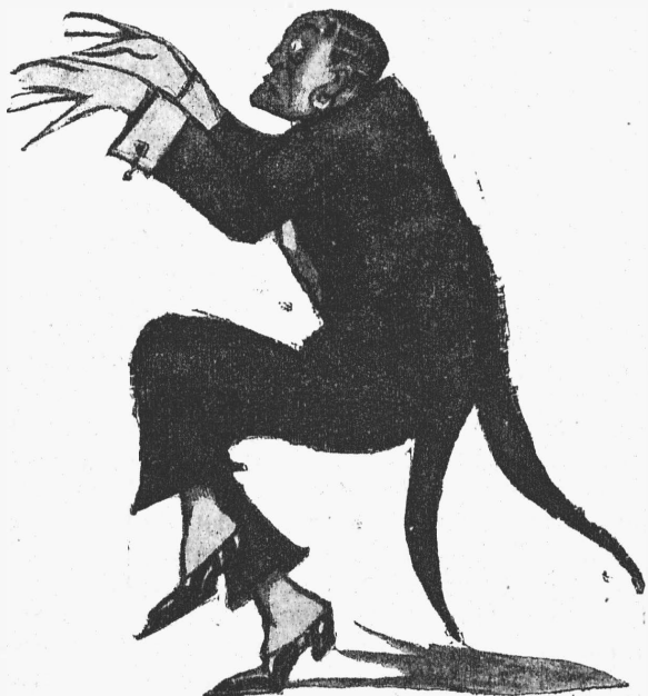
Король Сандвичевыхъ острововъ (г. Чугаевъ). „Король веселится“. (Шаржъ г. Дени.)