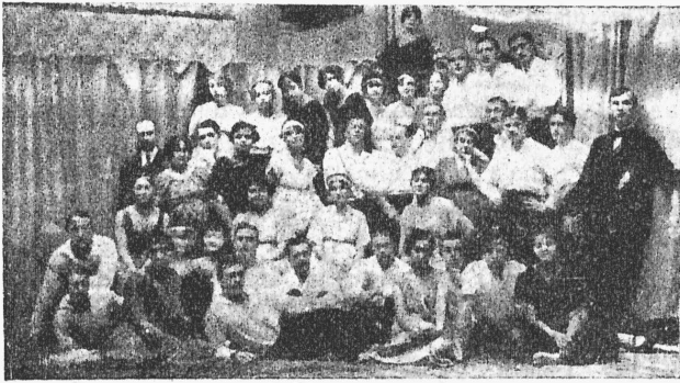
Балетная группа г. Дягилева въ Нью-Йоркѣ.