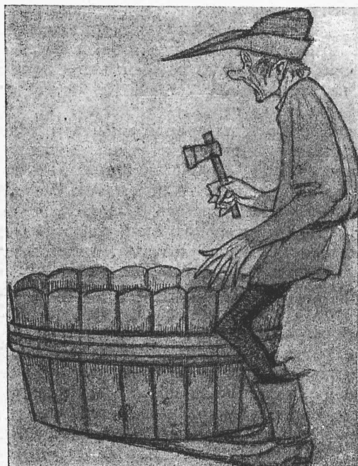
Бочаръ (г. Германъ). „Боккаціо“. (Рис. г. Дени.)

Талантъ Казанли не былъ глубокимъ, онъ не задавался какими-либо музыкально-философскими проблемами (хотя и увлекался Вагнеромъ), не обладалъ и яркимъ индивидуальнымъ характеромъ. Но его музыка все же заслуживаетъ серьезнаго вниманія, какъ человѣка одареннаго, технически зрѣлаго, согрѣтаго истинной любовью къ искусству. Онъ не былъ послѣдователемъ крайнихъ теченій, но не былъ и консерваторомъ (въ лучшемъ смыслѣ этого слова), какимъ является теперь, напр., Ляпуновъ. Казанли, будучи умѣреннымъ, вопли „современенъ“. Въ этомъ насъ убѣждаетъ какъ оркестровка его, пользующаяся нерѣдко современными достижениями, такъ и гармоническая основа его произведеній, нисколько еще не устарѣвшая. Поэтому мы думаемъ, что болѣе детальное ознакомленіе публики съ его творчествомъ является ближайшей задачей нашихъ концертныхъ учрежденій, какъ задачей его друзей является приведеніе въ извѣстность и порядокъ неоконченныхъ Н. И. композицій. А что такія есть, въ этомъ нѣтъ сомнѣній, такъ какъ