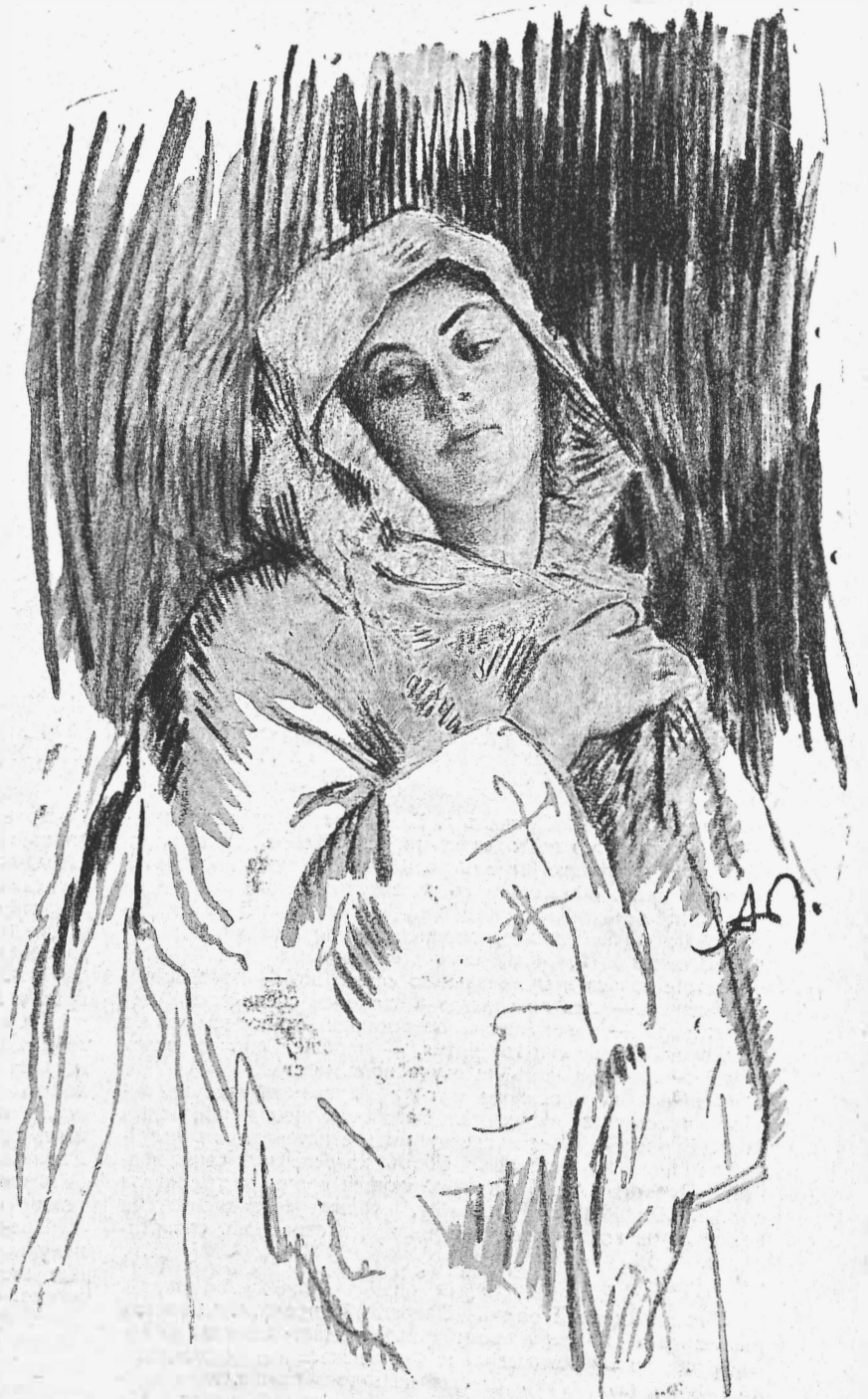
Опера Н. И. Казанли „Миранда“.

Изъ оригинальныхъ композицій Казанли наиболѣе извѣстна публнкѣ „Вилла у моря“, красочная и талантливая музыкальная картина съ ярко схваченнымъ настроеніемъ произведенія Беклина, искусно переведеннаго съ живописнаго на музыкальный языкъ. Произведеніе это въ послѣднее время часто появлялось на концертныхъ программахъ. Всѣ же остальные композиціи пребываютъ въ неизвѣстности.