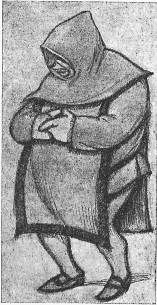
Ламбертуччіо (г. Ростовцевъ). „Боккаціо“. (Рис. г. Дени.)

Нѣкоторыя изъ нихъ исполнялись самимъ авторомъ въ Мюнхенѣ. Въ Россіи же никто не хотѣлъ ихъ исполнять.