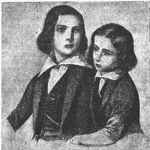
Николай и Антонъ Рубинштейны въ дѣтствѣ.