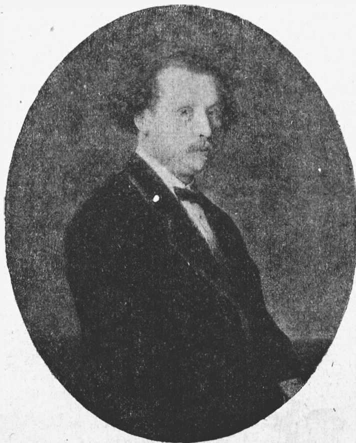
Н. Г. Рубинштейнъ. (Къ 50-лѣтію московской консерваторіи).