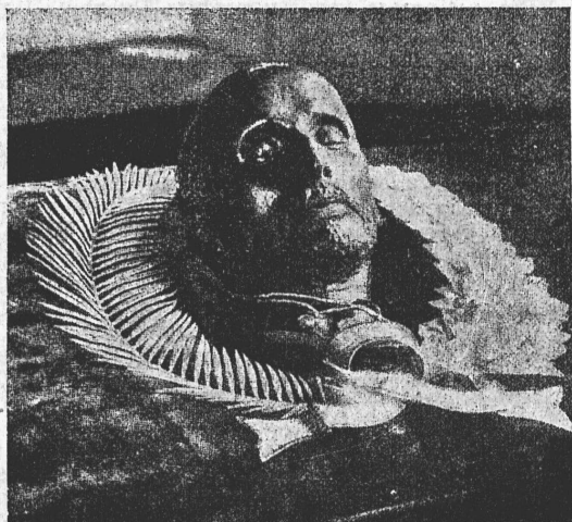
Бронзовая маска Н. Г. Рубинштейна, сдѣланная въ Парижѣ.

Правда, къ началу 60-хъ годовъ такихъ широкихъ баръ въ Москвѣ уже не было, но руководство въ области изящнаго все-таки оставалось въ этой средѣ, и потому Н. Рубинштейнъ вращается среди нихъ. Генераль-губернаторъ П. А. Тучковъ, милѣйшій господинъ, охотно идетъ навстрѣчу затѣямъ Н. Рубинштейна и даже предоставляетъ залы генераль-губернаторскаго дома для хора, готовящагося къ концертамъ Музыкальнаго О-ва.