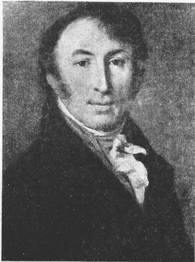
Н. М. Карамзинъ. (Къ 150-лѣтію со дня рожденія).