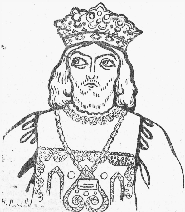
Іоаннъ Лейденскій (г. Алчевскій). „Іоаннъ Лейденскій“.

ничность представляет сущность, непремѣнное условіе, законъ драмы. Театральность же есть не болѣе, какъ внѣшняя форма, иногда даже уклонъ, а если хотите, карикатура сценичности. Сценичность вытекаетъ не только изъ архитектурники пьесы, но также изъ ея внутренней необходимости, изъ развитія ея интриги, изъ послѣдовательности ея психологическихъ моментовъ. Всѣ великія драматическія произведенія сценичны. Необычайно, положимъ, сцениченъ Островскій, но развѣ онъ театраленъ, въ узкомъ смыслѣ этого слова? Въ „Бѣшеныхъ деньгахъ“, на примѣръ, всѣ 5 дѣйствій расположены по одному и тому же шаблону появленія дѣйствующихъ лицъ. Съ точки зрѣнія театральности, это утомительнѣйшее однообразіе, это техническая, можно сказать, беспомощность, но сценическая сторона этимъ не затронута, потому что вниманіе и любопытство публики къ развитію интриги и морально-бытовой задачѣ пьесы все время остается напряженными. Такъ называемые эффекты и coups de théâtre бываютъ также сценичными или только театральными. Въ сценическомъ смыслѣ coup de théâtre необходимъ, представляя высшую точку напряженнаго дѣйствія, моментъ перелома, то, что у Аристотеля, въ его теоріи трагедіи, называется „узнаніемъ“. Но въ театральномъ смыслѣ формы эффектовъ и coups de théâtre могутъ быть безконечно разнообразны, дѣйствуя на зрителей элементами зрѣлища или потрясенія.