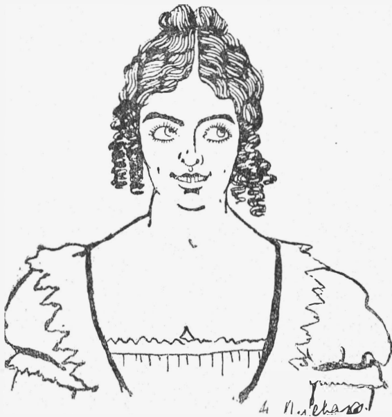
Г-жа Надеждина. „Записная книжка“. (Рис. Н. Плевако).