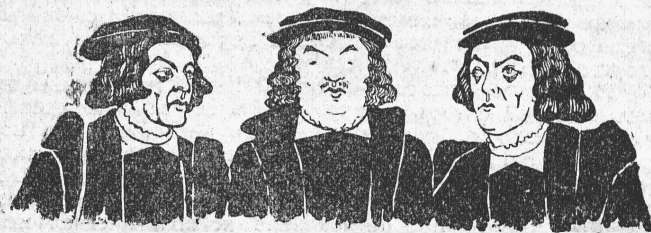
Анабаптисты—г. Боссъ, г. Угриновичъ, г. Преображенскій. „Іоаннъ Лейденскій“ (Рис. Н. Плевако).

Любопытно, что въ спискѣ дѣйствующихъ лицъ къ героинѣ, Клавдіи Владимировнѣ, поставлена