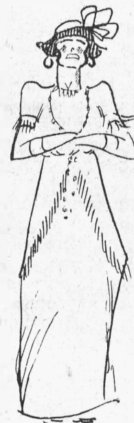
Пѣвица Нахальская. „Благотворительный концертъ въ г. Крутогорскѣ“. (Рис. А. Шабадъ).