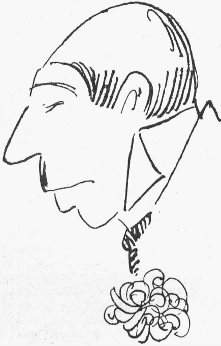
Ник. Серг. (г. Степановъ). „Три сердца“. (Рис. А. Шабадъ).