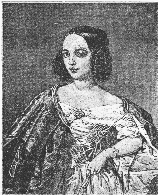
В. Н. Асенкова. (Къ 100-лѣтїю рожденїя—1-го апрѣля).