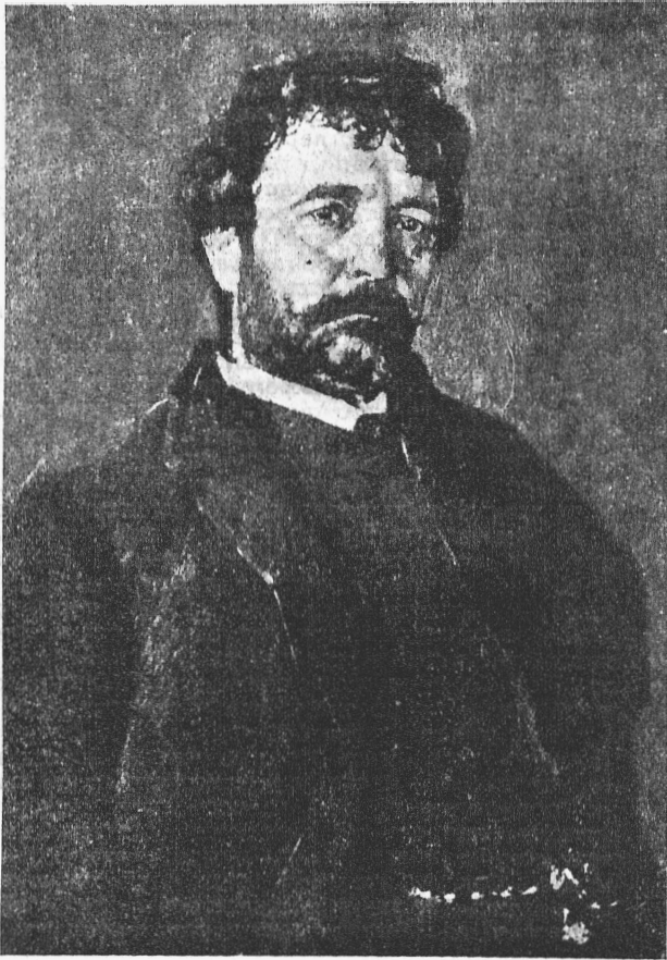
М а з и н и.

В. А. Сѣровъ. („Библ. иллюстр. монографій“.—„Свободное искусство“).