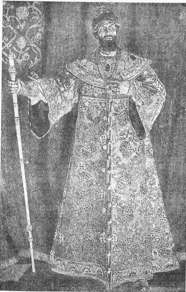
Ф. И. Шаляпинъ въ роли Бориса Годунова. (Портретъ работы А. Я. Головина). (Къ гастролямъ въ оперѣ Народнаго дома).