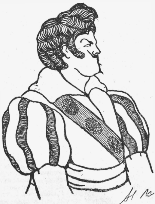
„Каменный гость“ (Г. Тартаковъ). (Рис. Н. Плевако).