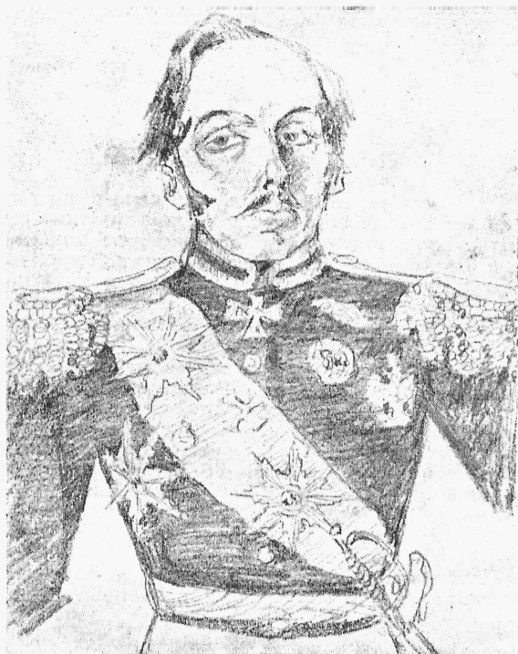
Принцъ Слонай (г. Фенинъ). „Принцъ Лутоня“ (Рис. Ягги). (Къ гастролямъ въ Москвѣ).

шихъ, наиболѣе самобытныхъ и свободолубивѣйшихъ артистовъ—г. директоръ являлся отраженіемъ того, потусторонняго міра, гдѣ сіяютъ царисолнца, и откуда, черезъ вицъ-мундирныхъ вельможъ, проливаются благодѣтельные лучи на все произрастающее. Что тутъ можно было сдѣлать даже самому энергическому человѣку? Да и кто такой былъ, въ сущности, самъ директоръ театровъ? Человѣкъ, которому была поручена извѣстная отрасль искусства, въ интересахъ національной культуры, или же maitre des plaisirs высочайшаго двора?