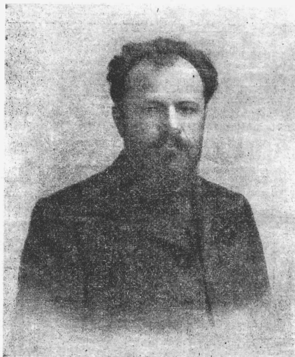
Вл. И. Немировичъ-Данченко.