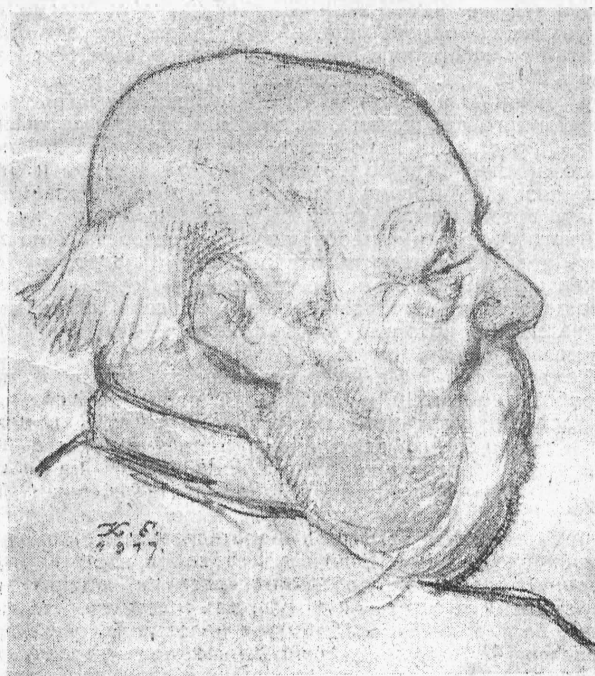
Капитанъ Прелестниковъ (г. Давыдовъ). „Милые призраки“. (Рис. К. Елисева).