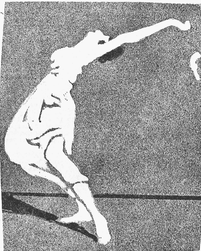
„Отчаяніе“, эскизъ для пантомимы.

Наряду съ этими пьесами шли и другія, иногда имѣвшія успѣхъ, а иногда его не имѣвшія, что неизбѣжно во всякомъ театральномъ дѣлѣ. Сама я въ текущемъ сезонѣ выступила только въ двухъ новыхъ пьесахъ: въ „Войнѣ женщинъ“, прошедшей 18 разъ и моемъ „Цвѣткѣ зла“—