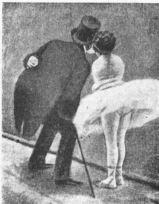
Передъ закрытымъ занавѣсомъ.