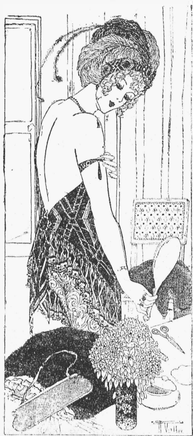
Въ уборной—передъ выходомъ на сцену.