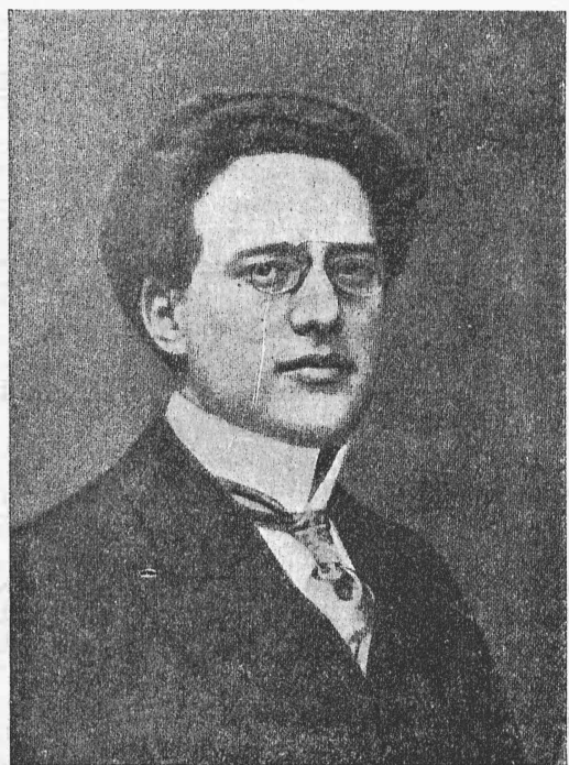
Дирижеръ Гр. Фительбергъ. (Къ сезону симфоническихъ концертовъ въ театрѣ Музыкальной драмы).

Увеличенїе бюджета театровъ въ смыслѣ повышенїа окладовъ для тѣхъ, кто получалъ ничтожное содержанїе, было необходимою, чтобы хоть нѣсколько сгладить неравенство въ распредѣленїи этихъ окладовъ. Отстранить