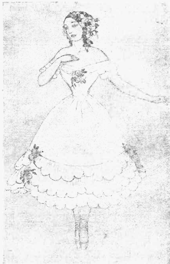
Изъ театрального альбома худ. М. Бобышева. (Эскизъ костюма къ бал. „Эрость“).