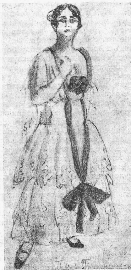
Г-жа Тамара—Грузинская („Идеальная жена“). (Рис. А. Шабадъ).