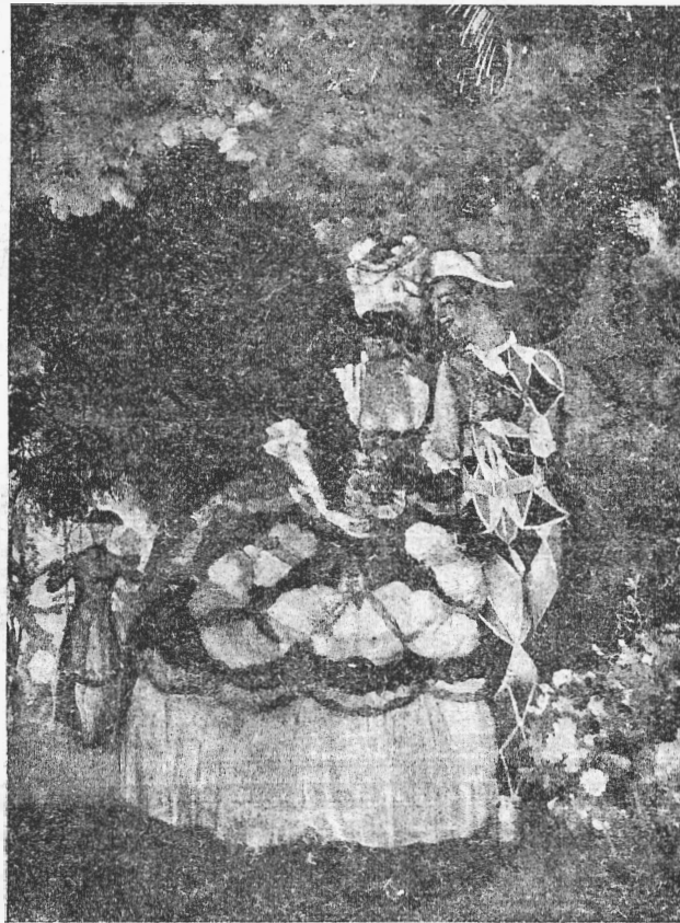
К. А. Сомовъ. — „Арлекинъ и дама“.