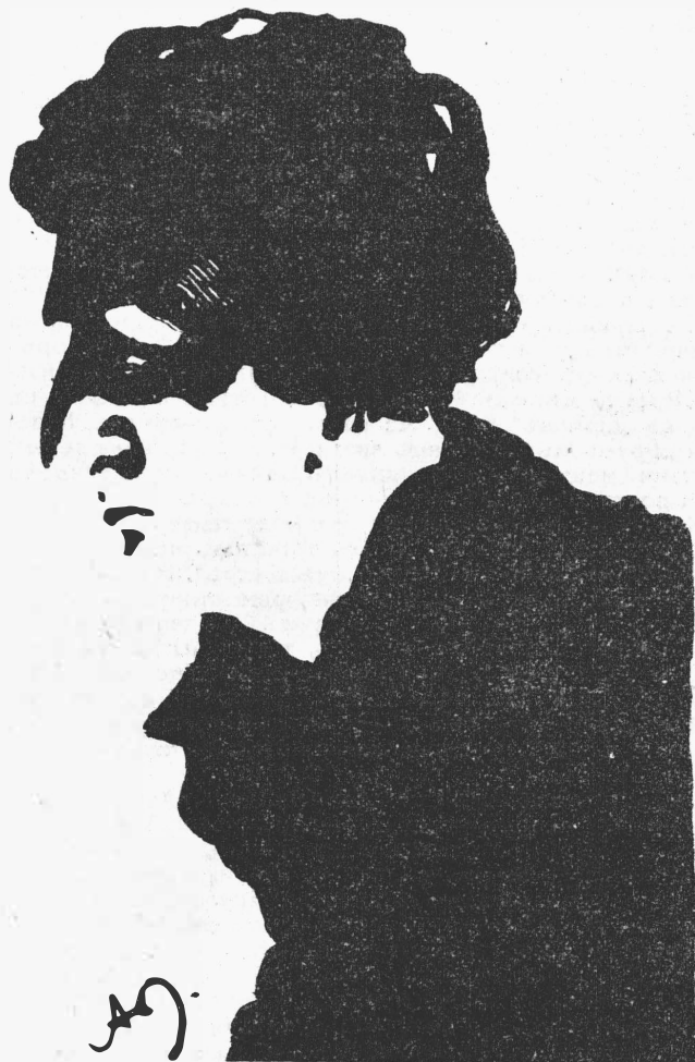
Изъ альбома худ. А. М. Любимова.—„Оперный артистъ“.

Гвоздемъ программы оказался куплетистъ—пѣсня про Дуньку и Пантелея, какъ онъ „скинувши фуфайку, подвигался ближе къ ней“, да еще исторія злосчастной барыньки