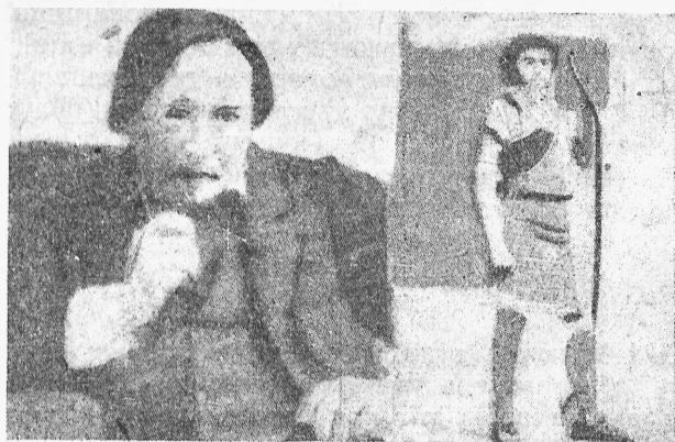
† Гербертъ Три, извѣстный англійскій артистъ