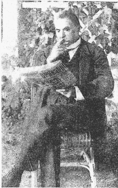
В. И. Сафоновъ въ Кисловодскѣ у себя на дачѣ.