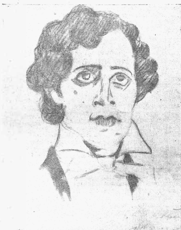
Н. Бравинъ.—„Идеальная жена“. (Рис. А. Шабать).