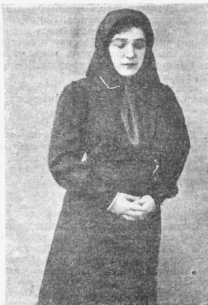
Артистка московскаго Малаго театра В. Н. Пашенная въ пьесѣ „Торговый домъ“. (Къ 10-лѣтію сценической дѣятельности).