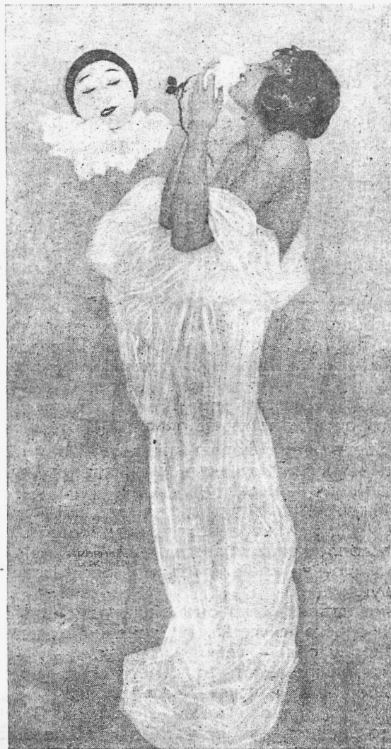
„Пьерро и его любовь“.—Видѣніе Пьерро. (Рис. худ. Кирхнера).

Вл. Соловьевъ, вѣруя въ дѣйственное, преобразующее людей искусство, присвоилъ ему и названіе Теургіи, т. е., Божественнаго Дѣйства — изліянія милующей и спасающей Благодати. Отсюда,