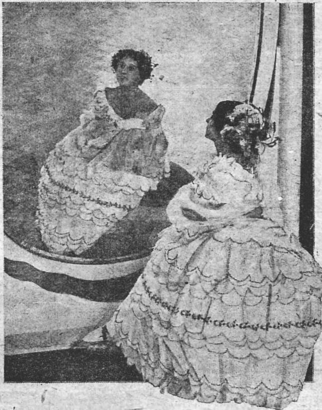
Т. П. Карсавина въ „Карнавалъ“. (Къ открытію балетнаго сезона).