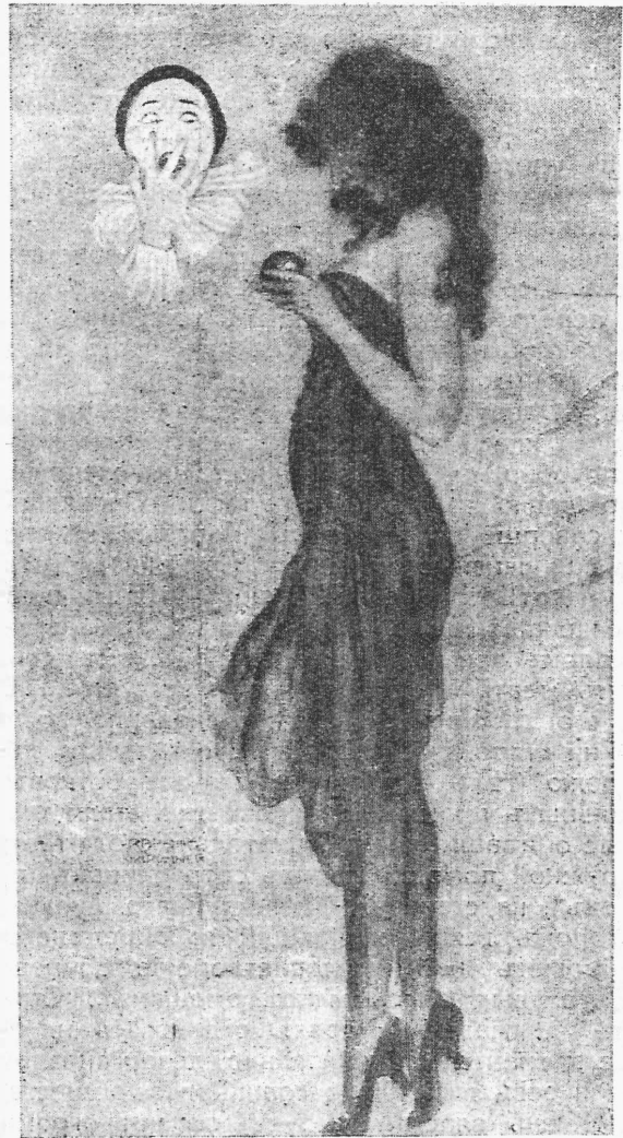
„Пьерро и его любовь“.—„Искушеніе“. (Рис. худ. Р. Кирхнера).

У насъ нѣтъ еще достаточно полной исторіи русской общественности, и опредѣлись въ ней роль театра, какъ гуманистическаго фактора, не представляется возможнымъ. Но роль эта была уже не совсемъ незначительной. По крайней мѣрѣ, мы при выкли такъ думать. Отсюда и наше къ нему уваженіе. Такъ было до послѣдняго времени. Но вотъ наступила счастливая эпоха, не теоретической только, а вполне и сугубо реальной, переоцѣнки всяческихъ цѣнностей. Пути цензурной опеки и административнаго усмотрѣнія, сковывавшія творческіе порывы театра и орлиный полетъ вдохновенія