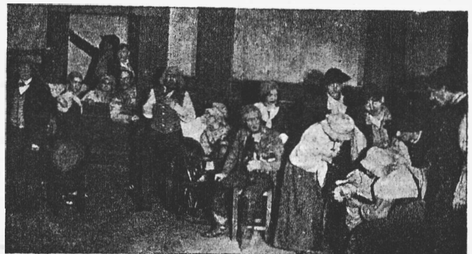
„Ткачи“. (Постановка Н. Н. Урванцова).