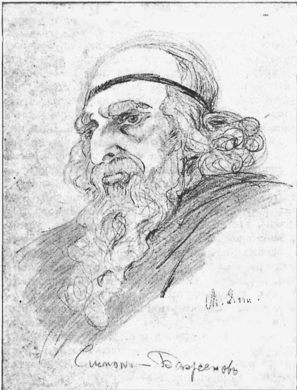
Симонъ (г. Баженовъ).—„Царь Иудейскій“.

Я самъ страдалъ... Страданія народа Понятны мнѣ, и я ихъ искуплю! Я былъ въ плѣну... Не бойся же, свобода, Я правъ твоихъ не оскорблю! Къ трофеямъ всѣмъ родной моей державы, Къ названіямъ Ваграма, Ровиго, Прибавлю я иной названья славы И герцогомъ я сдѣлаю Гюго!..