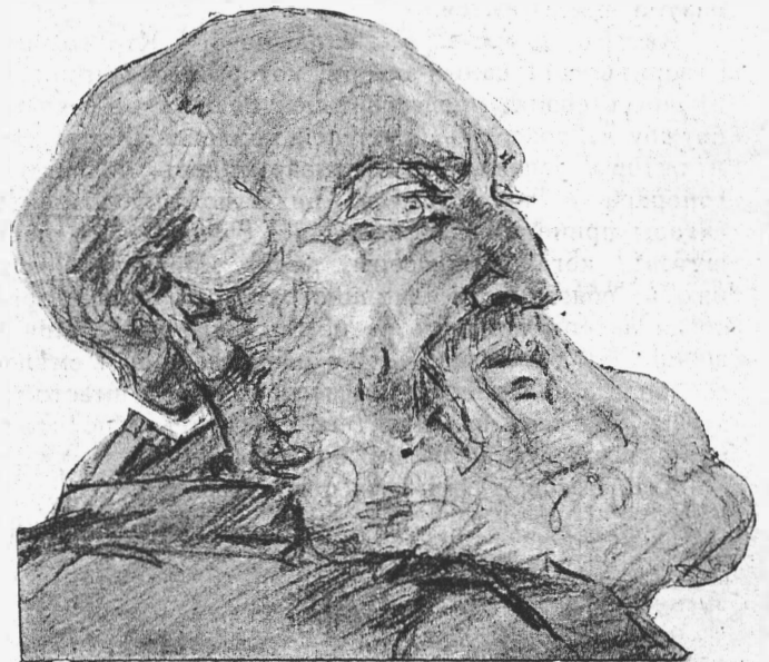
Никодимъ (г. Маликовъ).—„Царь Иудейскій“. (Рис. М. Ягги).

Но буффонада притягиваетъ недомыслие, чушь всегда функціонально связана съ разгильдяйствомъ. Въ томъ же засѣданіи было предложено покаяться передъ нѣмецкими драматургами. Въ этомъ ангажементѣ покаянія, въ этой сердечной квитанціи русской любвеобильности—таже характерная черта. Безвольный рус-