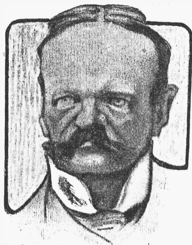
† Арриго Бойто.

ленное желаніе, въ сущности, и не способно дать прочнаго счастья, ибо вслѣдъ за осуществленіемъ желанія, должно неизбѣжно наступить нарожденіе, возбужденіе новаго желанія. Искусство, въ своемъ идеальномъ устремленіи, только этимъ и занимается—вѣчно неудовлетворенностью и ненасытимою алчностью чело-вѣческаго духа.