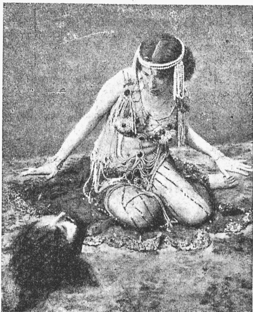
Англійская танцовщица Модъ Алланъ исполняетъ танецъ Саломеи. (Къ скандальному процессу въ Лондонѣ.— См. „Мал. Хрон.“)

себя социалистическими брошюрами,—нужды въ сим- волахъ уже больше нѣтъ, ибо все ясно, какъ на ла- дони, и въ мѣстномъ совдепѣ тебѣ сейчасъ же ска- жутъ, „что каждая звѣзда на небѣ значитъ“. „Со- ціаль - демократическіе вопросы остались недо- ступными его (Ибсена) пониманію“. „Изъ недозрѣлыхъ“, какъ снисходительно замѣчаетъ предтеча нынѣшнихъ мэтровъ социализма, мэтръ Губаревъ изъ тургенев- скаго „Дыма“... „Недозрѣлость“ же Ибсена въ смыслѣ социализма объясняется тѣмъ, что онъ выросъ въ „мелко-буржуазной средѣ“, и такъ до конца „не вы- яснилъ себѣ великаго историческаго значенія париж- ской коммуны 1871 г.“, и вообще, является жертвою „неразвитости норвежскаго рабочаго класса“.