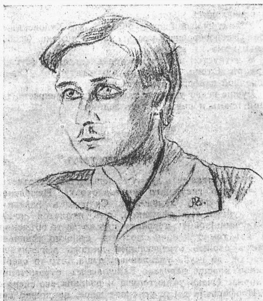
Ваня (г. Лихачев). „Блаженная“, О. Миртова. (Рис. А. Ванбуева). (К открытию сезона).