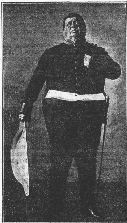
В. Н. Давыдов в роли Городничего. (К открытию сезона).

структурѣ, по сценической и психологической трактовкѣ, по необыкновенной разработанности и отдѣлкѣ, въ общемъ все же сталъ менѣе яркимъ, какъ нѣсколько выцвѣтшій рисунокъ. Но такъ-какъ это все-таки рисунокъ большого мастера, то и въ потускнѣвшемъ видѣ онъ продолжаетъ оставаться и цѣннымъ, и значительнымъ.